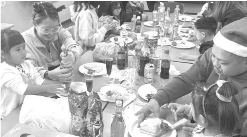
パパとママと一緒にデコレーション