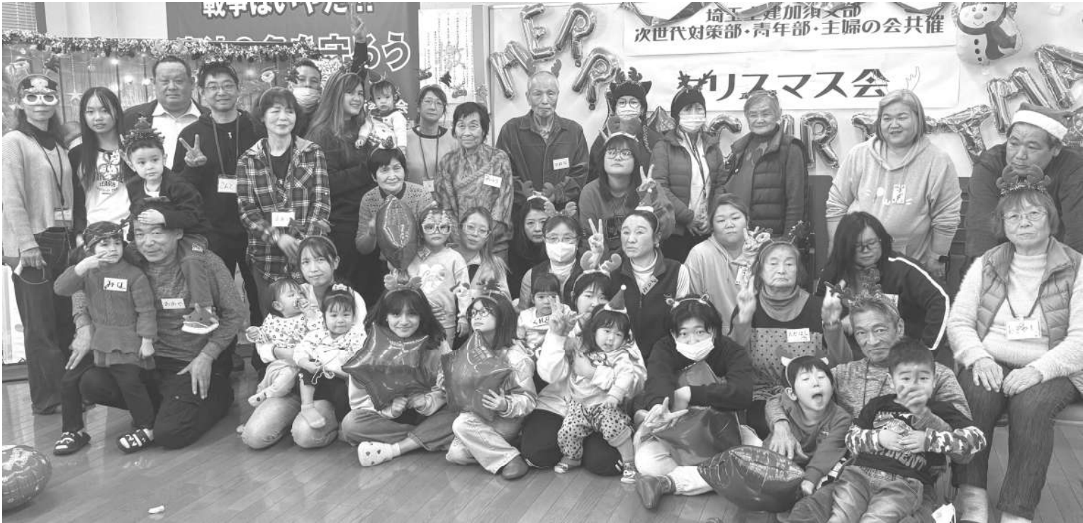
サンタの帽子やトナカイのカチューシャを身に着けて