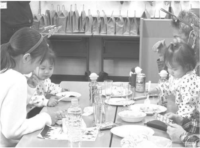
自分で作ったケーキを食べて

12月21日、加須支部事務所2階にて全体で45名、6家族14名のお子さんが遊びに来てくれて、とても賑やかな「わいわいお楽しみクリスマス会」を開催しました。