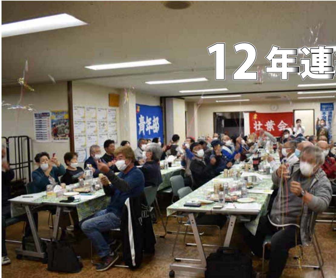
クラッカーで秋の拡大月間の目標達成を祝い=支部事務所にて

埼玉土建一般労働組合朝志和支部 〒351-0007 朝霞市岡3-24-37 TEL048-462-1303 FAX048-463-7059 《発行人》朝志和支部教育宣伝部 第221号 定価30円 (機関紙代は組合費に含まれています) MAIL asashiwa@saitama-doken.or.jp