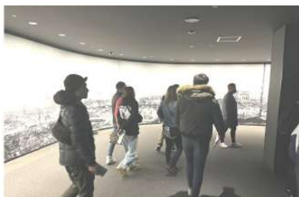
悲惨な現状を目の当たりに