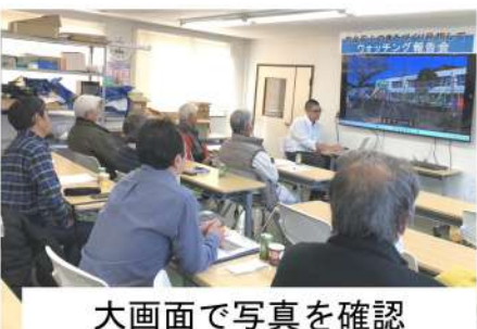
大画面で写真を確認

12月3日(日)午前中に街の危険箇所を探す「ウォッシング行動」を行いその後、参加した6分會17人が集まり27カ所を点検し報告会を行いました。 報告会の中で、保育所の周りの擁壁のひび割れや、門扉の錆つき、