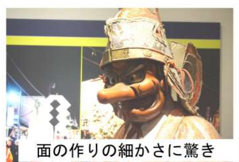
面の作りの細かさに驚き

以前の夜祭の様子が流れていきました。子どもから年配者までが屋台を引いたり、掛け声を掛けあう姿は鳥肌が立ちました。 屋台の中で踊る神楽