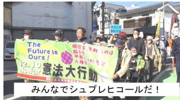
みんなでシュプレヒコールだ!