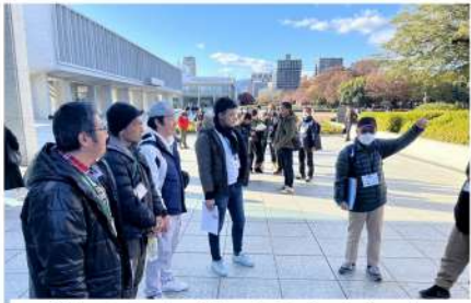
説明を真剣に聞く参加者