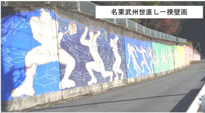
名栗武州世直し一揆壁画

最後にいった「吉田石間交流学習館」は、秩父事件をインターネット調べていた時に偶然見つけました。この学習館は、町に事前予約が必要で、金、土、日曜日の13時~16時までしか開館していない資