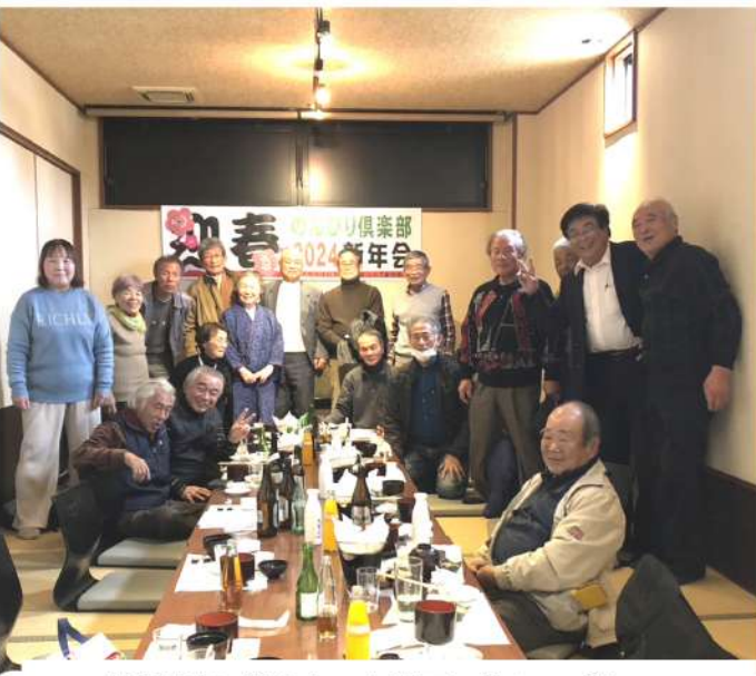
「機関誌に載るよ」と満面の笑みでパシャ!

参加者からはインボイスと消費税申告がわからないという声が多く聞かれました。分からない事は支部へご連絡ください。【田中書記記】