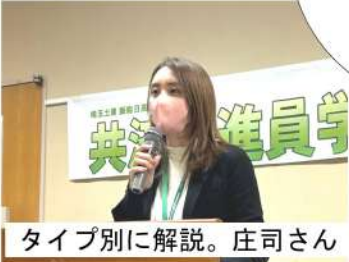
庄司さんによるタイプ別に解説

こくみん共済COOPは、安い掛け金で大きな保証がある「こくみん共済」と埼玉土建などの団体を通じてしか入れない「アシスト」が紹介されました。