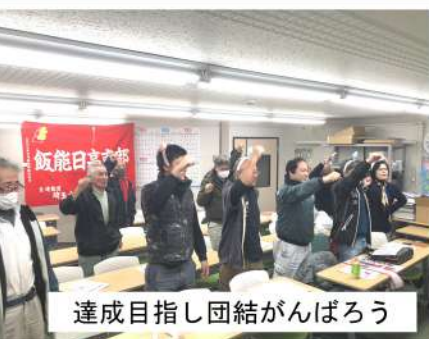
達成目指し団結がんばろう