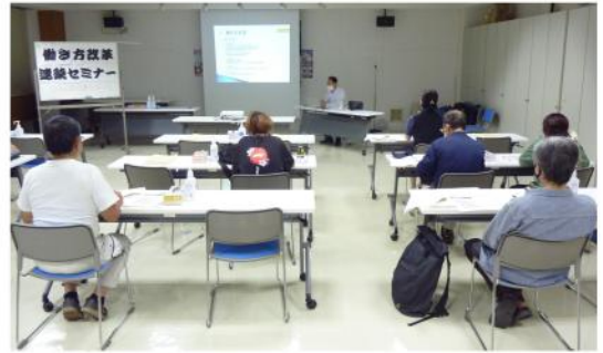
真剣に話を聞く参加者たち

9月28日（木）支部事 務所3階で、働き方改 革連続セミナー第1部 『働き方改革とは』 が、社会保険労務士法