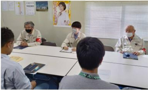
企業、新座市、埼玉土建で懇談

どの影響を受けた場合 の単価交渉が工期の長 い職種（鉄筋、型枠、 内装など）で相談が寄 せられ、根拠があれば 対応すると回答があ り、新座市側もスライ ド条項を適用した現場 について認識していま した。