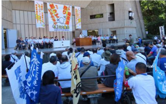
建設アクション集会の様子

その後、14時30分頃 にデモ行進を行い日比 谷から銀座通りを通つ て東京方面へ約2km