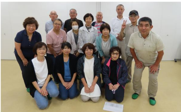
片山分会 共済目標達成！仲間訪問の大切さを再認識

も9月8日に出陣式を片山集会所において16人の参加で行い、分会執行委員会に続き、拡大行動についての相談をしました。個人では大変厳しい状況で事業所の新規雇用を期待しています。