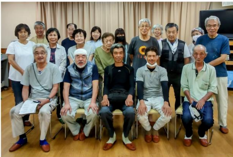
栄池田分会 出陣式にて結束を確認