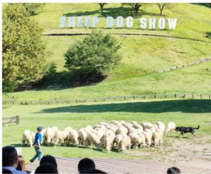
シープドッグショー