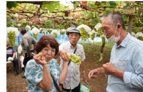
シャインマスカット食べ放題

ネルの大渋滞に巻き込まれましたが、車内でビンゴゲームに盛り上がり、「釣りバカ日誌」の映画を楽しみながら、予定時間少し過ぎに、無事支部事務所前に到着し、皆沢山のお土産を抱えて、解散となりました。