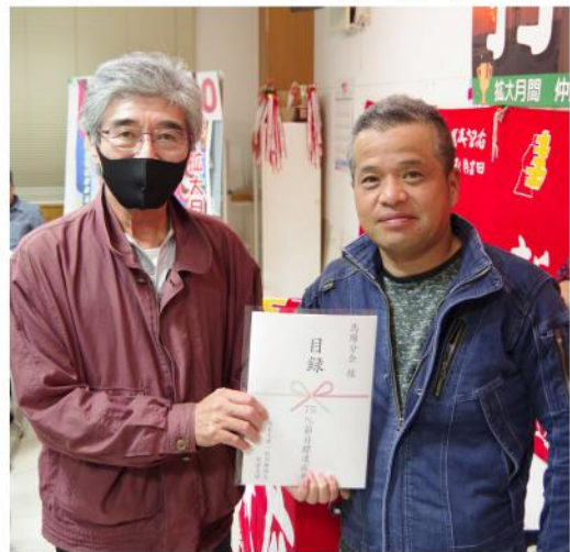
組織部長賞1位は馬場分会

求に拡大、最後の最後まで諦めなかつたことが支部目標達成へ繋がりました。 達成していない分会も今日は胸を張って飲み