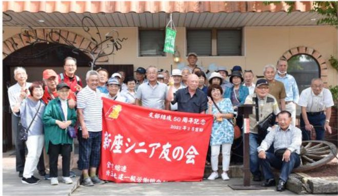
シニアはみんな仲よし

10月1日(日)に、32名が参加して新座支部シニア友の会のバスハイクが行われました。年寄りには朝が早いとよく言いますが、予定より10分ほど早く全員が集合し8時少し前に支部事務所前から、トイレ付きのバスに乗車して一路甲州路へ向かいました。