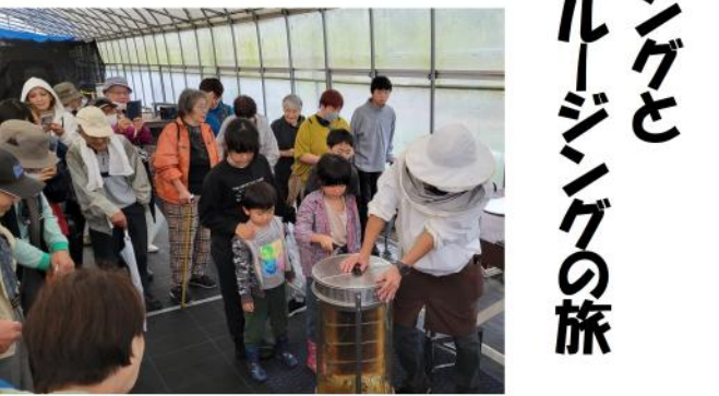
ハチミツを絞って試食

秋の拡大月間分会目標を10月12日(木)に達成した石堀分会は15日(日)に千葉方面に厚文バスハイクを組合員とその家族37人の参加で行いました。あいにくの雨でしたが、午前8時に石神を出発しました。高速道