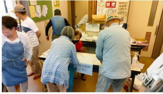
住宅相談も好評です

当分会の最大行事でもある住宅デーです。何日も前から皆頑張つて準備をしてきたのですが、残念ながらお天気には見放されてしまいました。