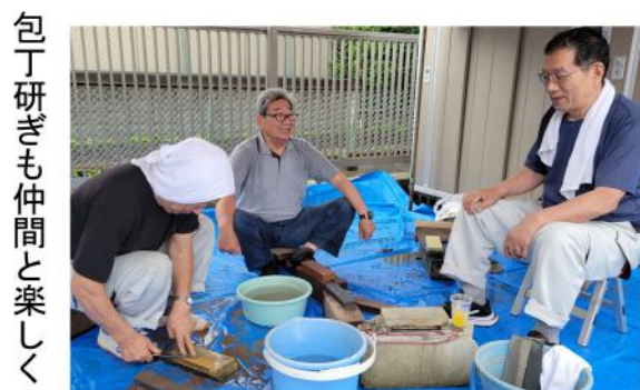
包丁研ぎも仲間と楽しく

会からの参加は少なかつたのですがテキパキと動いて流石主婦の会と感激しました。もちろん雨の中外では男性陣が身軽に動いていてとても頼りになりました。最後まで雨が止まらず雨の住宅デーとなりましたが、とても充実した住宅デーとなりました。野寺分会の焼きそばはとても美味しく、担当書記がいたら食べさせてあげたかったです。