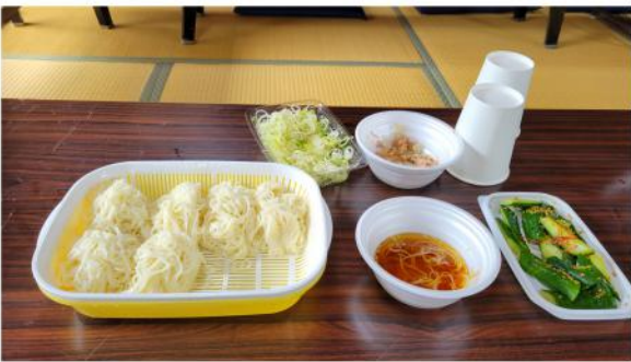
お昼は主婦の会の美味しいそうめん