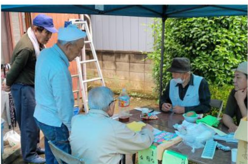
住宅相談はみんなの知恵を