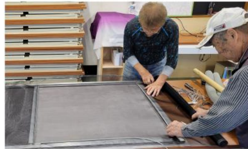
慣れた手つきで網戸を張替え

予報通りの朝からの雨でしたが組合員16人、主婦の会から2人の参加で朝9時から準備を開始しました。