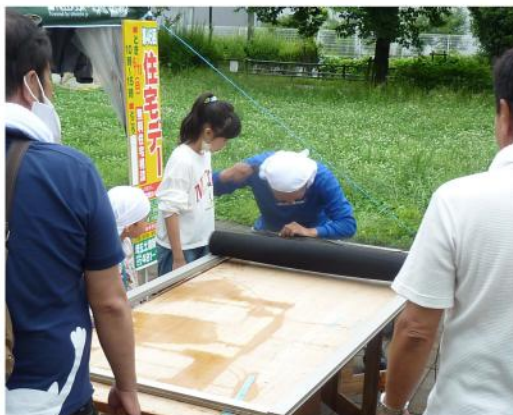
子どもたちも興味深々

6月11日の日曜日に全県の各地で住宅デーが行われました。今年野火止南分会と野火止北分会が合併して野火止分会となった初めての行事にもなりました。今日の為に合併前から話し合いと準備を進めてきました。その