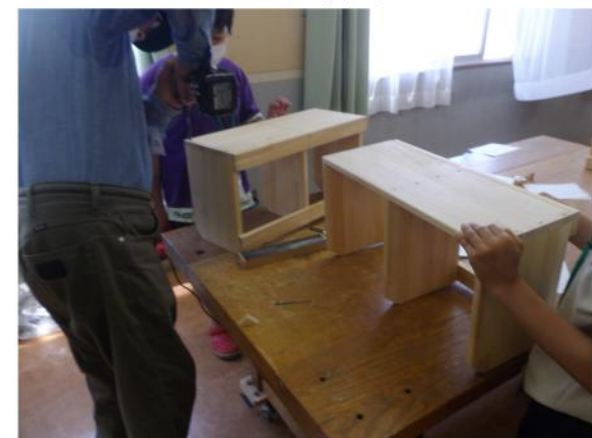
最後の確認は講師がしっかりと