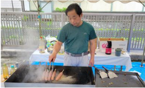
焼いてますフランクフルト

6月11日(日)第46回住宅デーがあり組合員24人主婦の会5人の参加で行いました。雨の降る中テントを設置して焼きそばやフラン