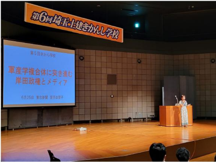
望月衣塑子記者の講演

最後に、「武装宣言が正気の沙汰か。それこそ狂気の沙汰だという結論は考え抜いた結果出ている。その歴史的使命を日本が果たすのだ」の幣原喜重郎の言葉と、「あなたのす