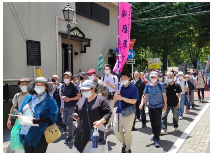
パレードの出発地点