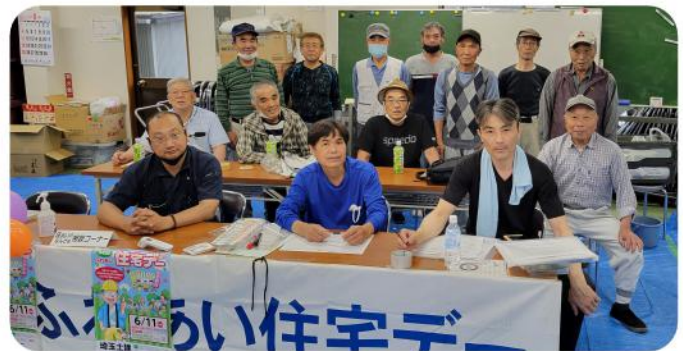
畑中の精鋭たちです