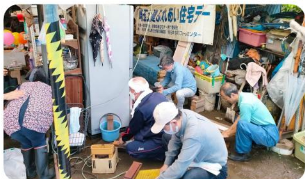
男性陣は包丁研ぎを

6月11日(日)小泉工務店作業所にて、第46回ふれあい住宅デーが開催されました。