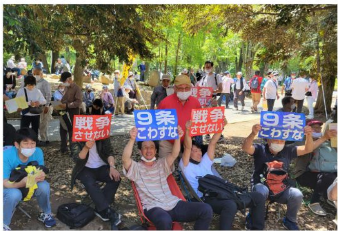
北浦和公園でアピール