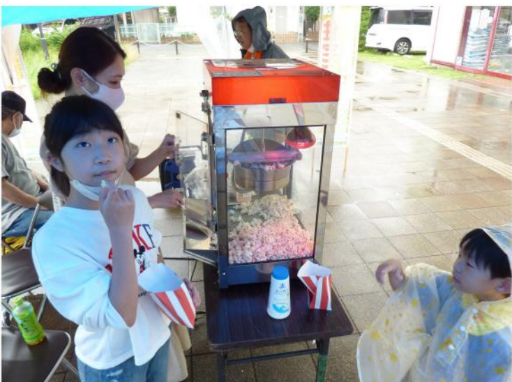
美味しくできて大満足