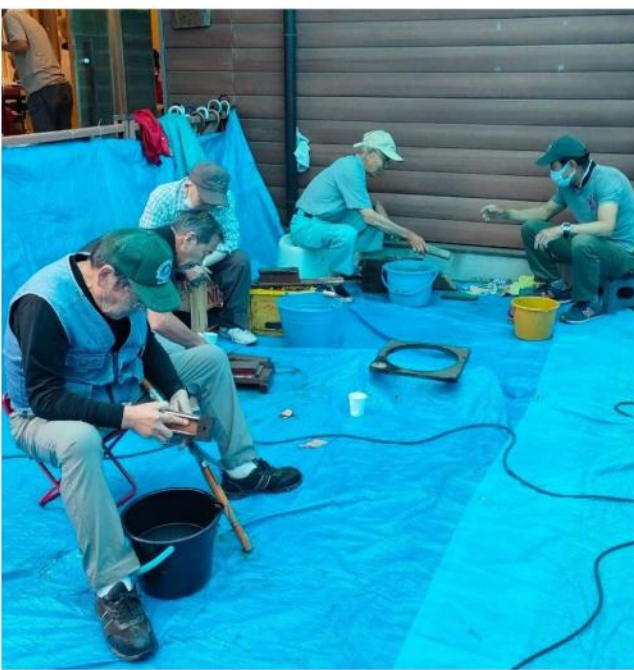
みんなで一斉に包丁研ぎ

朝9時前から雨降りのための準備でブルーシートを使い屋根づくりをしてお客様を待ちました。早い人は9時半ごろからぼつぼつとみえてあつとらっ間になってきました。一方中では主婦の会の皆さんが準備したバザーの商品が並べられ、なかなかの盛況でした。コロナ騒ぎでしばらくぶり解禁になったカレーライスやソーメンを作ったりと、お昼も楽しかったです。