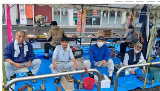
包丁研ぎは任せとけ

た。参加は組合員13人、主婦の会会員5人で、午後2時に受付を終了し片付けをしました。互いが協力し合いとても良い住宅デーが出来たと思います。