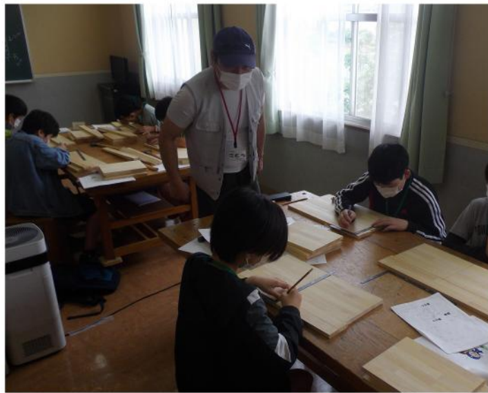
熱心に取り組む子供たち

子供もいたので丁寧に指導しながら、カンナで板の面取りをしてもらい1日目終了しました。