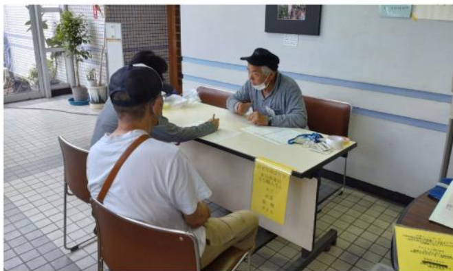
丁寧に状況を聞き取り