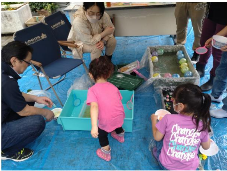
来場した子供達も大喜び