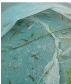
メダカもプレゼント