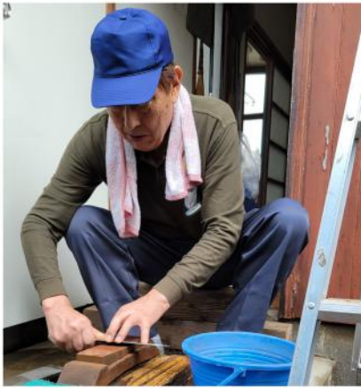
どんな包丁も切れ味抜群に

シートを使い屋根を作り10時の受付に合うように準備しました。無事に10時受付は開始できましたがこの雨です。道には人通りはなく不安を覚えましたが、元組合員さんなどが来てくれて包丁研ぎやまな板削りを開始しました。