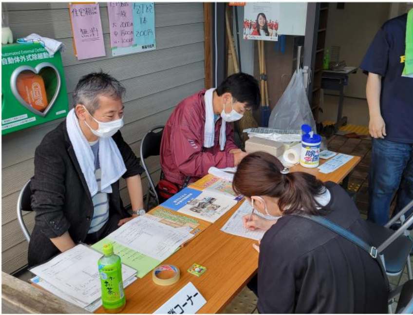
来場者には丁寧な案内を心掛けています