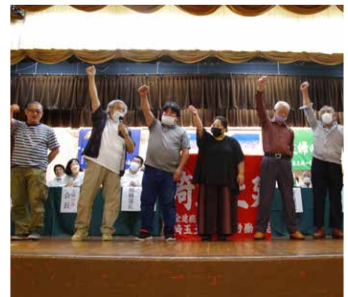
決意表明をする朝志和支部の仲間

結果も出た。日本でも、労働組合の真価を発揮していく必要がある。このミーティングで各支部・分会での取り組みや経験、悩みなどを率直に語り合い、交流しようと呼びかけました。