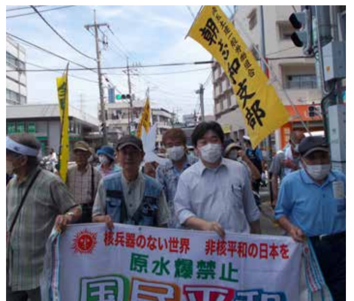
朝霞地域の平和行進の様子= 7月3日

休憩時間以外にも随時細かく休憩をとるように伝えたり、自販機や水道がない分、飲み物を人数分現場に持つていくなどの対応をしているとのことでした。ただし現場の中に事務所がないことや、トイレが1か所のみだったり、改善の要望を行いました。パートナーシップ協約の締結をお願いします。11時30分に支部事務所に戻り報告会を行いました。