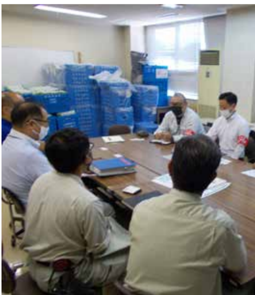
和光清掃センターの懇談の様子

朝霞は朝霞第2中学校の体育館エアコン工事(元請け・協和工業株式会社)で、朝志和支部からは4人、朝霞市から3人、元請けから1人が立ち会い、懇談を行いました。今回の現場ではトイレが少なく、男女分かれていないので改善を要望しました。 和光は和光清掃センター(元請け・田中建設株式会社)で、朝志和支部からは4人と鳥飼市議と田中建設から2人、和光市から2人が立ち会い、懇談と現場確認を行いました。懇談のなかで熱中症対策に力を入れていることが伝わり、決まった