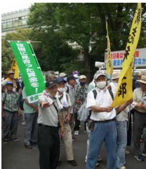
デモ行進に出発する朝志和支部の仲間

今決起大会では与党も野党も多くの政党の代表者が出席し、各政党の議員からいかに全建連連の力が強いのか、社会に対する影響力があるかを知らされました。