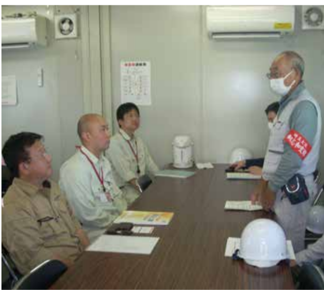
朝霞第2中学校改修工事の懇談の様子

休憩時間以外にも随時細かく休憩をとるように伝えたり、自販機や水道がない分、飲み物を人数分現場に持つていくなどの対応をしているとのことでした。ただし現場の中に事務所がないことや、トイレが1か所のみだったり、改善の要望を行いました。パートナーシップ協約の締結をお願いします。11時30分に支部事務所に戻り報告会を行いました。