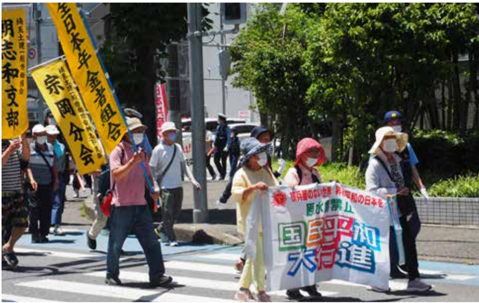
志木地域の平和行進の様子= 7月2日

第66回原水爆禁止国民平和大行進が今年も始まりました。志木地域平和大行進は7月2日(日)志木駅東口(マルイ側)広場で、猛暑のなか、午前11時から9団体51人の参加で行いました。朝志和支部からは29人の参加でした。