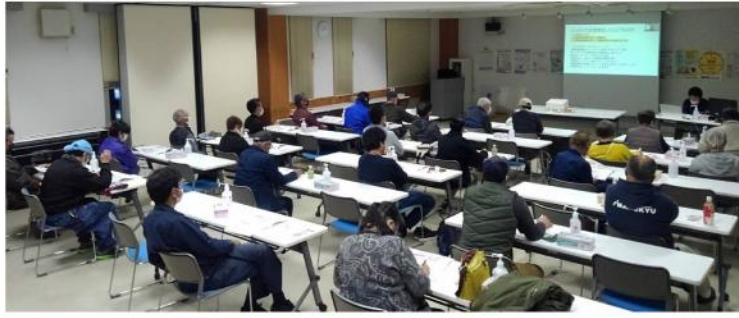
多くの参加者が集まった

り金になるのは、ゴルフ税、入湯税、東京都の宿泊税位である。インボイス制度には、全国の税理士が反対しているのに、日税連は、令和5年の建議書で、簡易課税制度のみなし仕入率の縮小を建議するという、とんでもないことをした。インボイス制度の次は、簡易課税制度の見直しで、みなし仕入率を改善するか、売上1千万円以上5千万円以下となっているものを引き下げるか、最悪の場合廃止される可能性がある。インボイス登録申請書の具体的な記入方法の説明がされました。登録申請は、税務署ではなく、関信越国税局管内は、(〒344-18680) 埼玉県春日部市大沼2丁目12番地1にあるインボイス登録センター(048-