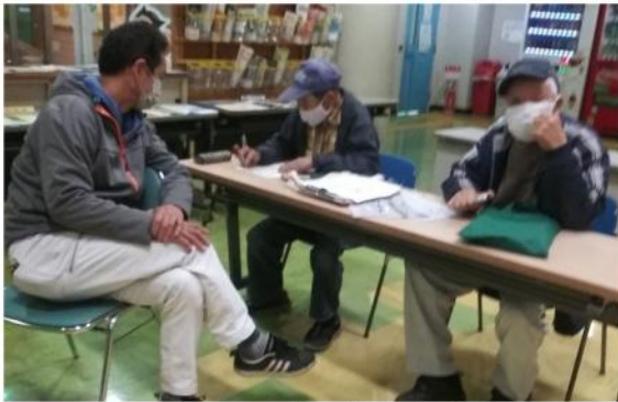
訪問先の打ち合わせ中

春の拡大月間が始まり分会執行委員会で3月の拡大行動日と集合時間、たまり場の確認を行い、仲間に協力を呼びかけました。しか