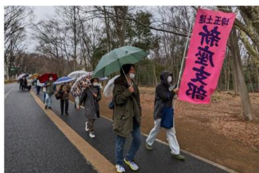
傘をさしながら税務署へ

一番最後の順番でした。この日は天気が悪く新座支部の順番の時間帯には大雨が降っていて、傘を差しながら税務署まで移動し申告、大きなトラブルはなく無事に参加者全員が申告を終えました。最近では「e-tax」(イータックス)で申請出来る事もあり、参加者は年々減少しています。物価、電気代の高騰や今年度からはインボイス制度が始まる可能性もあり、我々の生活をさらに圧迫して