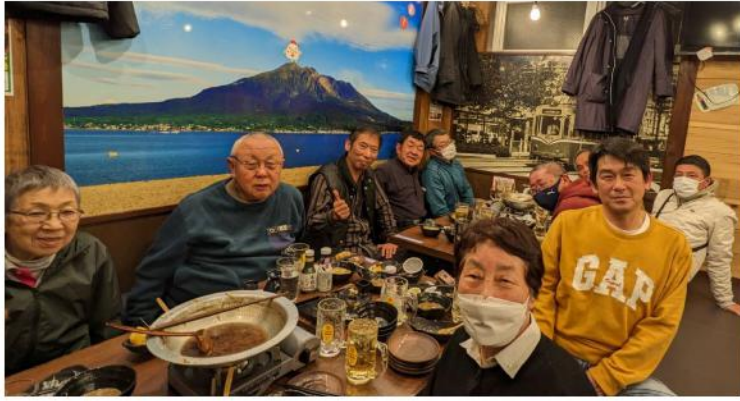
2月に行った分会役員交流会の様子

栗原分会の「春の拡大月間」統一行動は、栗原公民館ロビーに分会役員を中心に集合して行っています。立て看板の設置、埼玉土建のチラシ配布、班会議