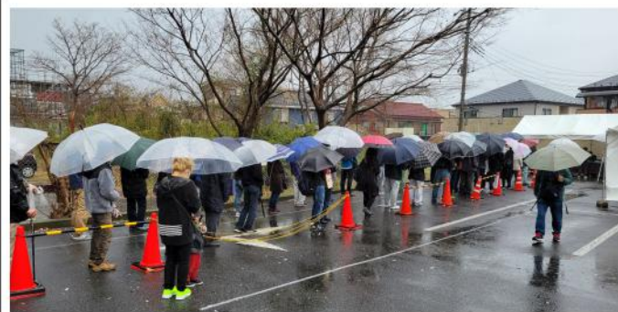
集団申告会場の様子

3月13日(月)に朝霞中央公園にて3・13重税反対全国統一行動が行われ、全体で185人、新座支部からは48人の仲間が集まりました。新型コロナウイルスの影響はまだ完全になくなっておらず、今年度も集会・デモ行進は行わずに朝霞中央公園に集まり、団体ごとに順次税務署に向けて出発し、集団申告を行って流れ解散となりました。新座支部は今年度は