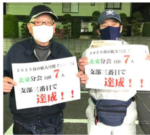
支部三番乗りで目標達成