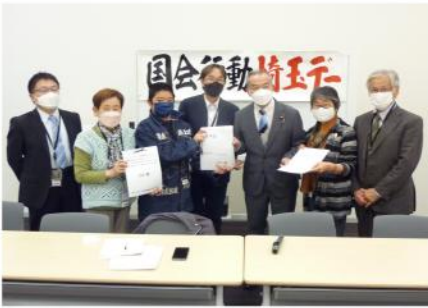
支援や暮らしを守る訴えを

10月から11月にかけて4回の国会行動埼玉デーを行ってきました。多くの団体が国会行動に参加し、消費税減税・インボイス制度の実施中止を求める要請と改憲発議反対と核