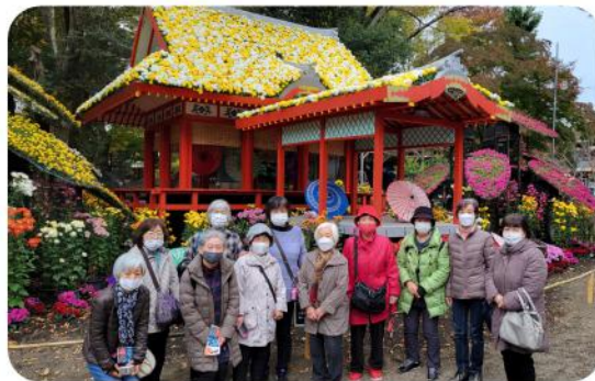
久しぶりのバスハイク、交流や繋がりも出来ました