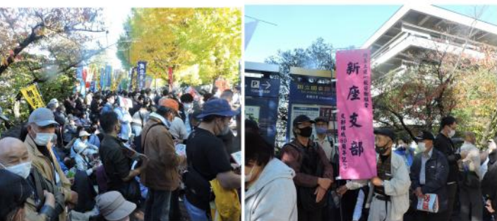
たくさんの人が集まりスピーチに耳を傾け

日本は広く世界に発信し核兵器使用の断念を核保有国に迫るべきです。核兵器の使用は未来を失うことを意味しますと訴えました。 こんな時期(コロナ禍による3密の徹底)ですが、各団体は日頃から着々と国民の命と生活を守るために頑張っています。