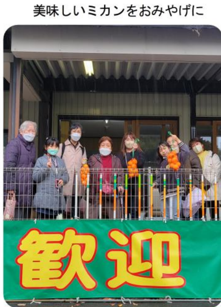
美味しいミカンをおみやげに

11月20日(日) 刻の7時30分にバス2台に分かれて47人(子ども10人)の参加で新座市役所から静岡県に向かって出発しました。 3年ぶりのバスハイクで皆さんとても楽しみにしていました。 最初の目的地は三島市立公園楽寿園、この日は三島菊祭りが開催されていました。大輪の菊や色とりどりの菊のオブジェがとても綺麗でした。子どもたちは園内にある動物広場や乗り物広場で沢山楽しみました。次に鎌倉殿の13人大河ドラマ館では、鎌倉殿の13人の登場人物の等身大パネルや衣装の展示、ミニドラマなどを見学しました。午後から天気が悪くなりミカン狩りは満喫とはなりませんでしたが、急遽干物で有名なお土産屋さんへ寄り、沢山お買い物をして頂きました。 帰りは事故渋滞もあり予定よりも大幅に到着が遅れてしまいました。が、久しぶりのバスハイクを皆さん喜んでくれました。