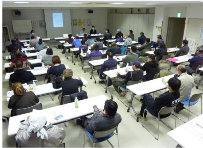
沢山の方に影響するインボイス制度