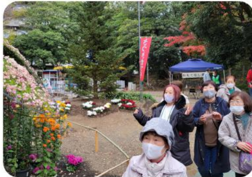
綺麗な花のオブジェを見ながら散策