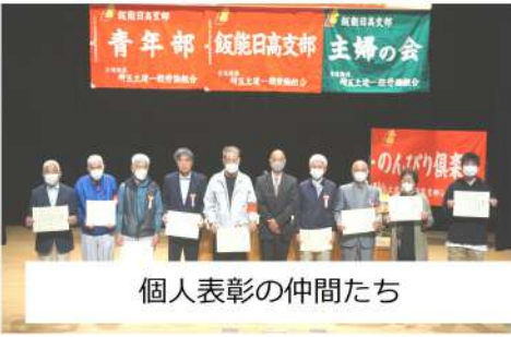
個人表彰の仲間たち