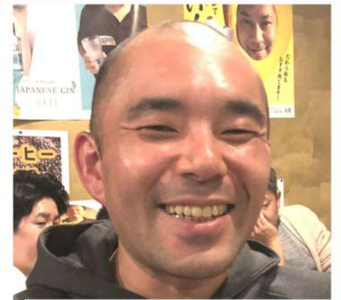
どんな時も奥さんと二人三脚♪