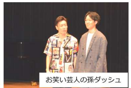
お笑い芸人の孫ダッシュ