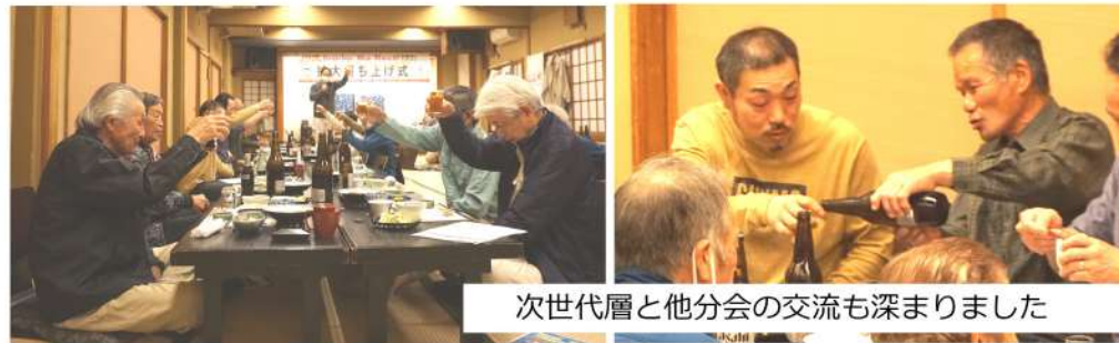
次世代層と他分会の交流も深まりました

達成にカンパイ お酒もおいしいね 春の拡大打上式を4月27日(木)19時から日高市の松竹で24人の参加で行われました。