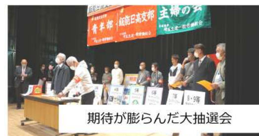
期待が膨らんだ大抽選会