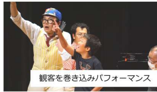
観客を巻き込みパフォーマンス