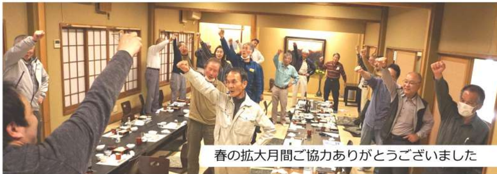
春の拡大月間ご協力ありがとうございました