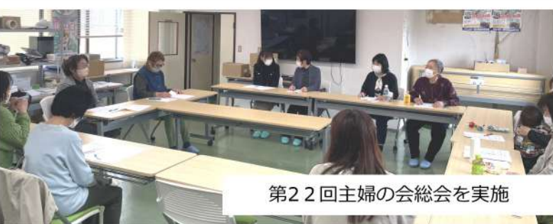
第22回主婦の会総会を実施