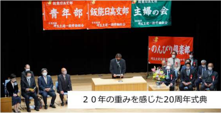
20年の重みを感じた20周年式典