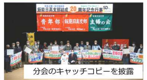
分会のキャッチコピーを披露