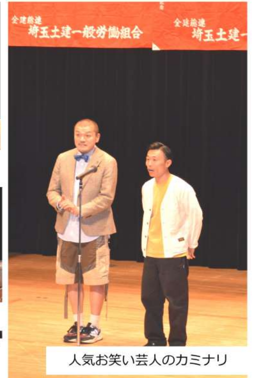
人気お笑い芸人のカミナリ