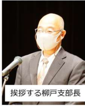
挨拶する柳戸支部長