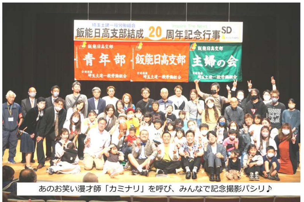
あのお笑い漫才師「カミナリ」を呼び、みんなで記念撮影パシリ♪

記念行事には、太鼓音楽集団の「鼓代神」や、パフォーマンスタウンの「しんぺいとちやくら&龍英」、若手芸人の「孫ダッシュ」、そして人気お笑い漫才師の「カミナリ」が登場しました。 詳細は2面へ