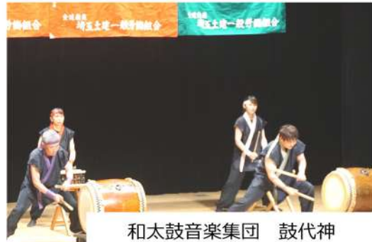
和太鼓音楽集団 鼓代神