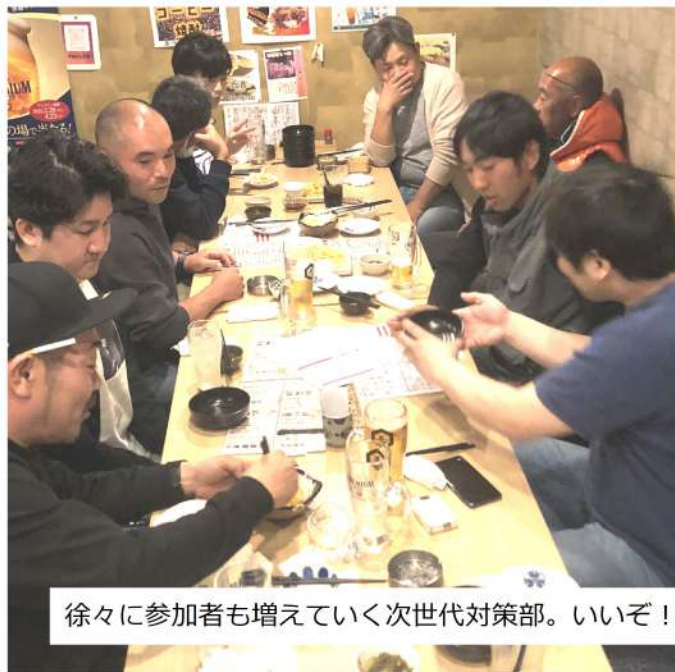
徐々に参加者も増えていく次世代対策部。いいぞ！