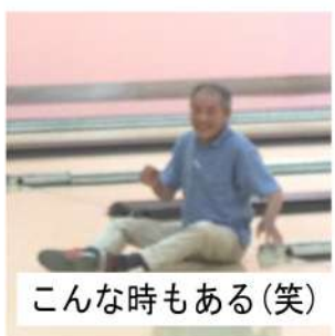
こんな時もある(笑)