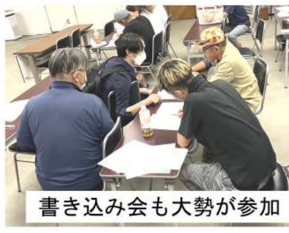
書き込み会も大勢が参加

専属で働いている元請けからインボイスの登録を求められている仲間は、インボイス登録をしないと仕事を貰えなくなる可能性があまりないので支部に相談をしてください。また、「売り上げから10%引くからインボイスを登録しなくていいよ。うちで消費税払うから」という元請けの場合は注意が必要です。消費税で簡易課税を選択した場合、申告時に支払う消費税は、