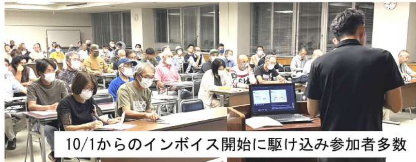
10/1からのインボイス開始に駆け込み参加者多数

9月26日(火)19時30分から人間市産業文化センターで西南4支部(所沢・狭山・人間・飯能日高)を対象に10月1日から開始される「インボイスセミナー」と個別相談会(書き込み会)が行われました。10月1日からインボイス制度の開始直前でセミナー参加者は78人(飯能日高支部からは7人)と、これまでのセミナー参加とは比べ物にならないほどの参加者となりました。