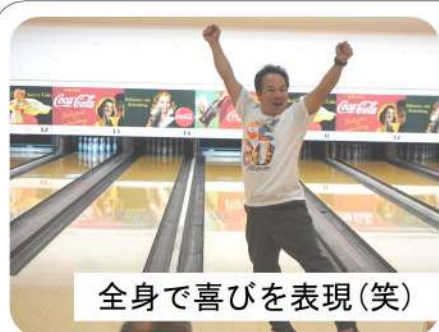
全身で喜びを表現(笑)