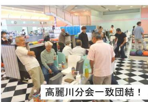
高麗川分会一致団結!