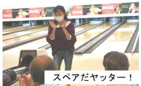
スペアだヤッター!