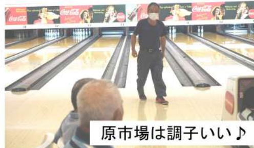
原市場は調子いい♪