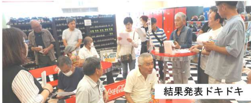
結果発表ドキドキ