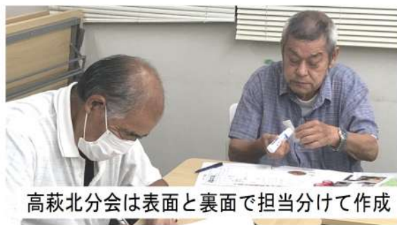
高萩北分会は表面と裏面で担当分けて作成

9月26日(火)19時30分から分会ニュース作成会が行われ、5分會7人が参加しました。10月の分会ニュースは、共済や国保で助かった経験をそれぞれ取材し、秋の拡大月間終盤に向けての拡大協力を訴える紙面となっています。また、分会ニュースを作成するにあたり、