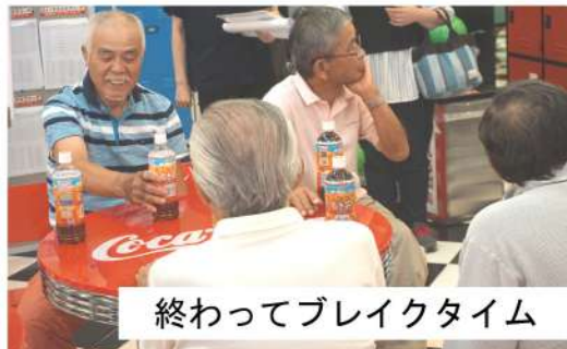
終わってブレイクタイム