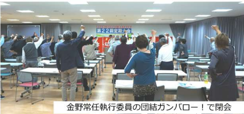
金野常任執行委員の団結ガンパロー!で閉会

では、昨年支部大会から本日(5月21日)までに他界された仲間の名前が読み上げられ、参加者全員で黙祷を行いました。