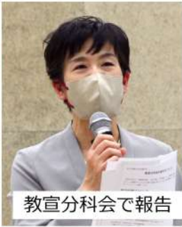
教宣分科会で報告