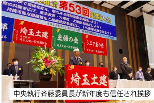
中央執行斉藤委員長が新年度も信任され挨拶