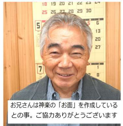
お兄さんは神楽の「お面」を作成しているとの事。ご協力ありがとうございます

抗していきま りまで登録せ れないという で元請けから しないとい しないう事 今年務めまし やり支部役員 その後、分会 いました。 の制度で助け た時に、国保 い2回の手術 は脊柱管狭窄 入れました。 けられ埼玉土 野總一さんに 近くに住んで り吾野に移り いろいろと縁 夜間の定時制 通い製図の勉 ていました。