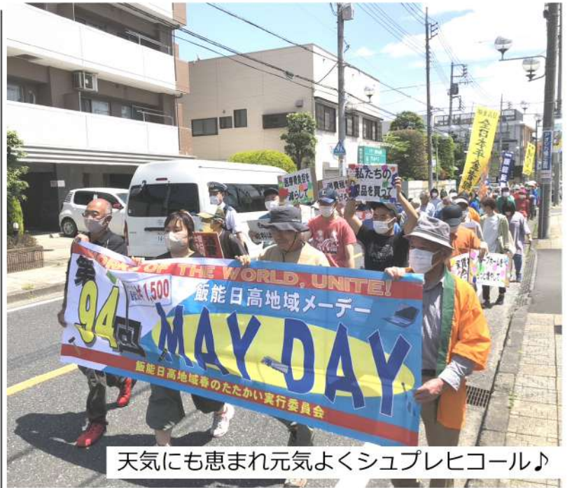
天気にも恵まれ元気よくシュプレヒコール