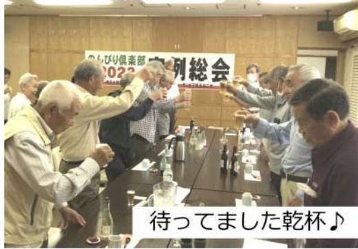
待ってました乾杯♪