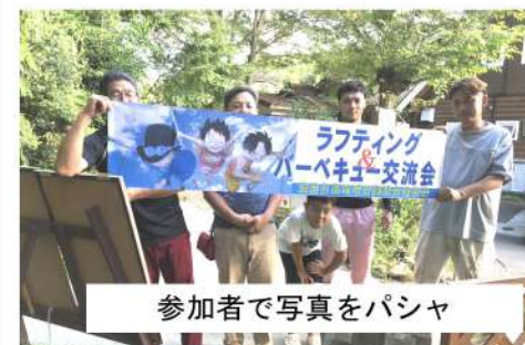
参加者で写真をパシャ

一緒に大人も夢中になり、相手のゴムボートめがけて水しぶきを浴びせ合いました。きありがとうございませ。今日の日を機会に、それぞれの職場で助け合い支え合い仕事をしたいければと思っております。小学生には今日のことを夏休みの絵日記にしてほしいと思います(笑)とあいさつがありました。