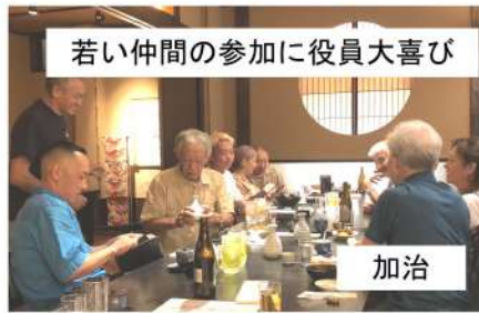
若い仲間の参加に役員大喜び

原市場分会は8月20日(日)の午前中に拡大行動を行い、12時から「台湾料理福来順」で秋の拡大分会出陣式を行い10人が参加しました。