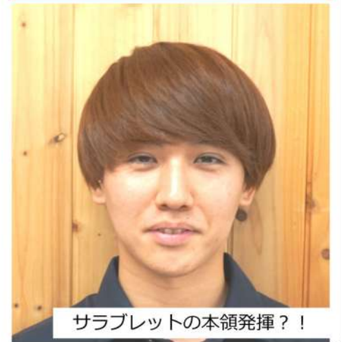
サラブレットの本領発揮！