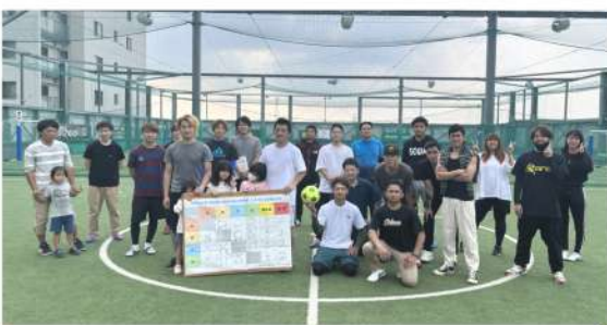
参加者全員でハイポーズ♪

午前中は「ヴァーサス新座フットサルクラブ」にてフットサルを楽しみました。他の支部と交流が深められるよう各支部混合の6チームに分かれ、それぞれが勝利を目指しながら熱い試合が繰り広げられました。