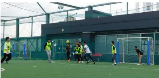
フットサルで汗を流し楽しむ青年部