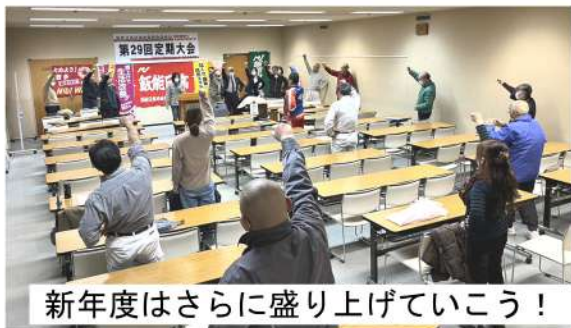
新年度はさらに盛り上げていこう！

11月28日(火) 18時30分から飯能市民会館202号室で飯能日高地域労働組合連合会の第29回定期大会が10団体26人(埼玉土建飯能日高支部から5人)、代議員14人、来賓4人、執行部8人の参加で行われました。