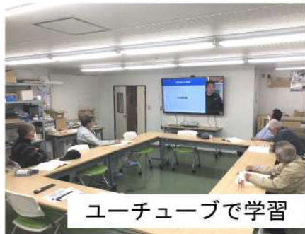
ユーチューブで学習