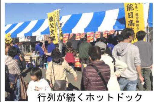
行列が続くホットドック