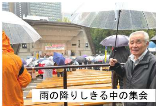
雨の降りしきる中の集会

激しい雨に見舞われながらも会場には全国各地から多くの参加者が集まり、賃金・単価の引き上げ、法定福利費の確保、来年度の国保予算確保の運動に団結して全力でたたかうことを確認し集会後半には天候も回復したことから、デモ行進を行うこと