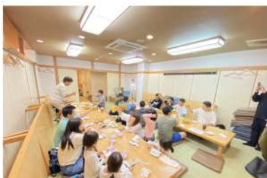
交流会楽しくスタート♪