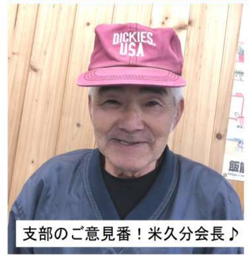
支部のご意見番！米久分会長♪

飯能支部に加入し ました。加入して4年 後には分会書記長を やっています、それか ら分会役員歴は今に 至ります。そろそろ 引退したいなあ(笑)。 繋がりを広めよう 埼玉土建の思い出 は、東北出身者で 「雪国の会」を作り、 宴会をしたこと。当 初は20人くらいいた かな？5回くらい交 流会をやってコロナ 禍となり今は、休憩 中だね。またみんな で集まりたいなあ。 仲間には伝えたい事 は、組合員の横の繋 がりをもっと広めて いければ仕事にも活 用できるのでは土建の 行事にもっと参加し てほしい。