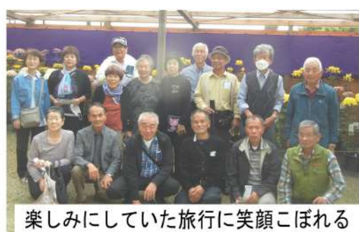
楽しみにしていた旅行に笑顔こぼれる

11月5、6日に北伊豆方面への一泊旅行が取り組まれ19人(女性6人、男性13人)で行ってきました。バスは大型のサロンのカーでゆつたりと乗ることができ、