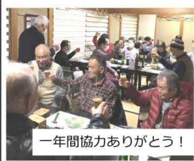
一年間協力ありがとう!

加治分会書記長の司会で「今年一年で一番うれしかったこと」と題して参加者全員による一