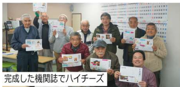
完成した機関誌でハイチーズ