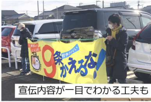
宣伝内容が一目でわかる工夫も