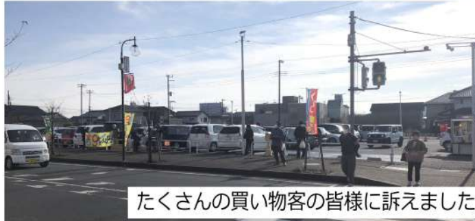
たくさんの買い物客の皆様へ訴えました