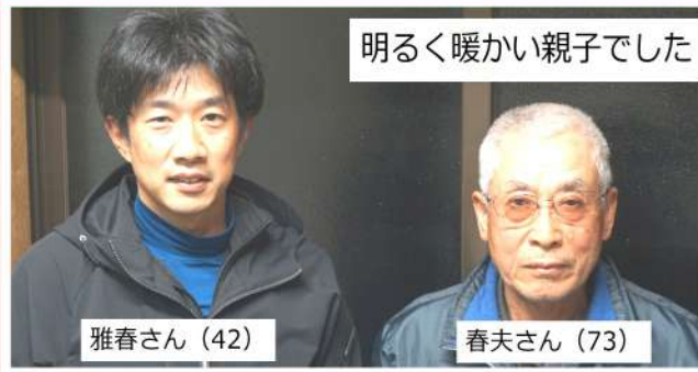
明るく暖かい親子でした