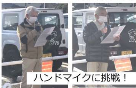
ハンドマイクに挑戦!