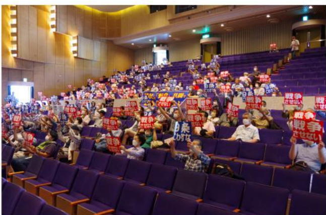
リモート参加ですが想いは熱く！

サークル活動の紹介記事を随時募集しています。自分の趣味を組合の仲間とやってみたい、これからサークル活動にしてみたいなどサークル活動を通じて、あらたな仲間との繋がりを作ってみませんか？ お問い合わせは支部事務所まで