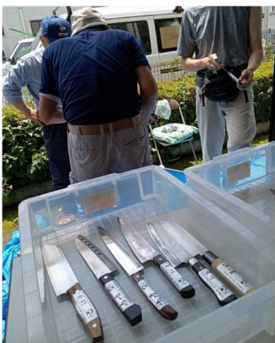
錆もキレイに落とします

談話は3件、包丁研ぎは28本、網戸は11枚でした。相談内容は玄関ドアの交換が必須か、こちらは即日伺い、調整で解決しました。