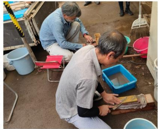
次々と包丁が届きました

包丁研ぎは13時の終了時間まで大忙しでした。開催中ずっと曇り空で雨の心配をしながらの開催でしたが片付けが終わるまで降られずによかったです。