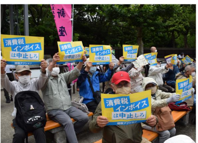
プラカードで中止を訴え!

6月29日(水) 12時30分から、猛暑日の中、日比谷野外音楽堂に、1703人(新座支部からは9人)が集まり、「6.29賃金・単価引き上げ、予算要求中央総決起集会」(集会後のデモは中止となりました)が、全建総連主催で行われました。