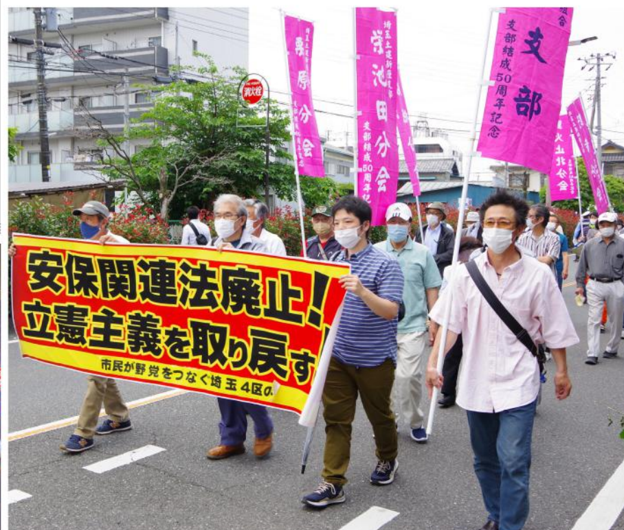
野次にも負けずデモ行進！

6月5日（日）午前10時より志木市民会館に於いて、6・5オール埼玉総行動が開催されました。