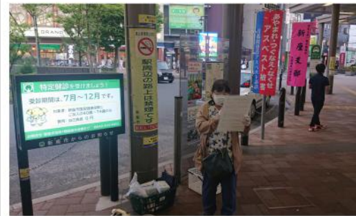
交代でマイク宣伝！

テイッシュ配りと署名も行い、署名は7筆と中にはカンパをしてくれた方や、解体業で自分もアスベストを沢山吸ったという方の話も聞くことが出来ました。