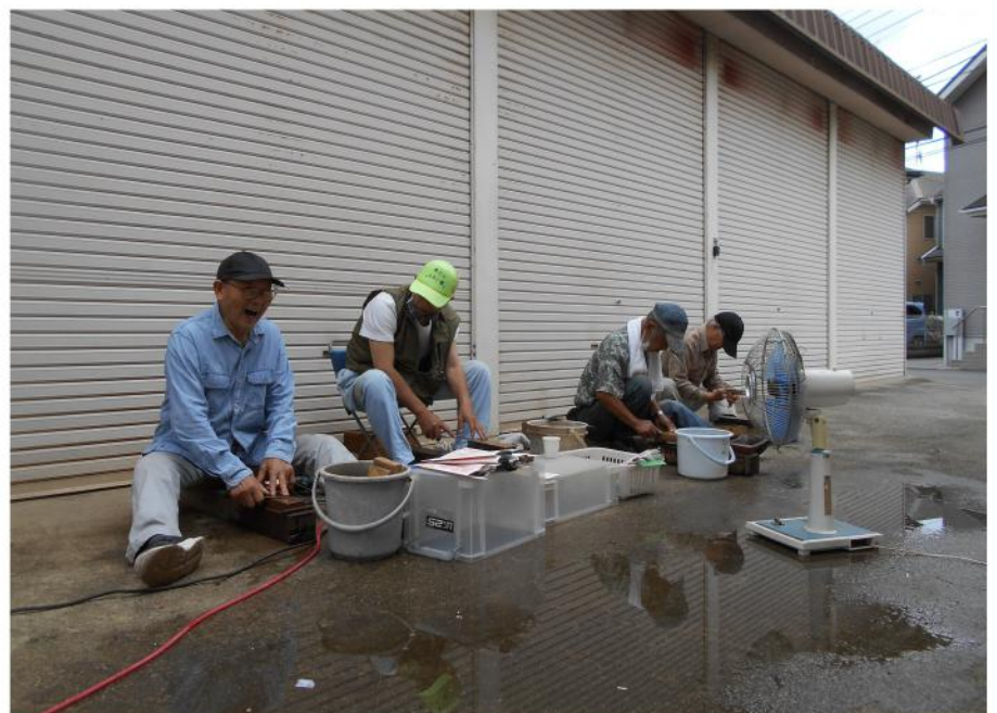
大工さんの腕の見せ所！