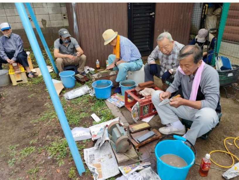
包丁も鉄もお手の物!