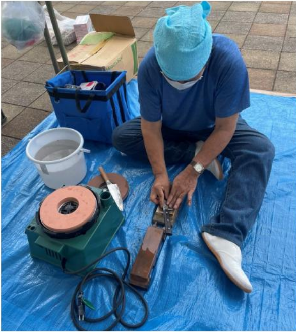
昼食で英気を養い包丁研ぎ