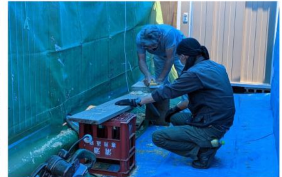
ベテランの技は衰えません

た。打ち合わせの時は大丈夫かなと少し心配もありましたが、住宅デーの時は結束力が高まる分会です。10時の開場に間に合わせる事ができ、実行委員からのあいさつで来場者を迎え入れました。