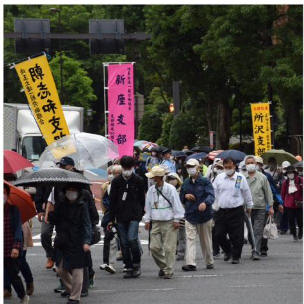
多くの仲間とデモ行進