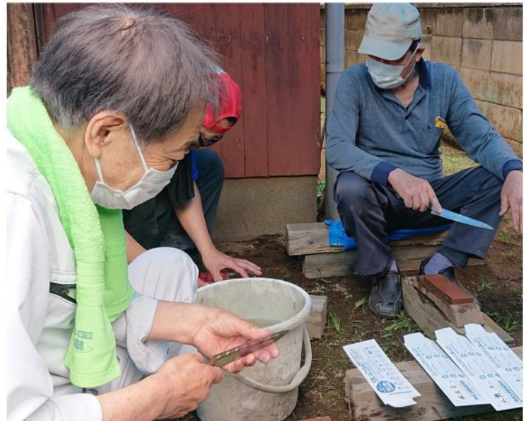
念入りに切れ味を確認