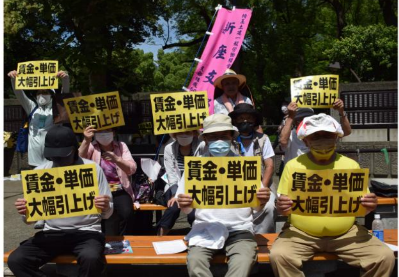
猛暑に負けない熱い訴え!

来賓あいさつでは、自民党の平沢勝栄衆議院議員、立憲民主党の枝野幸男衆議院議員、国民民主党の浅野哲衆議院議員、公明党の塩田博昭参議院議員、共産党の宮本徹衆議院議員の5人の議員が、猛烈な暑さのため短めに