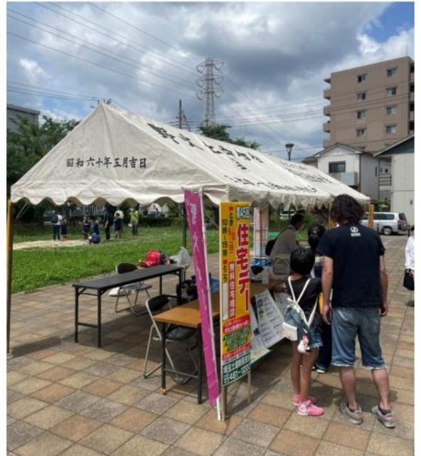
天候も味方してくれました

は、包丁2本と網戸2枚を持ってきた際に「自宅のドアのクローザーがおかしいのですがどこにお願いすればいいですか？」と言われたので「後で伺いますよ」と午後一番で約束し訪問しました。見た所ドライバーとビス