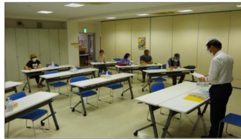
小石社労士による全体学習