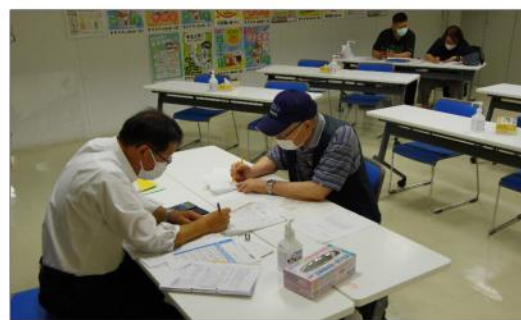
個別でチェックや相談を