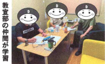
教宣部の仲間が学習

組合員の皆さん、市民に知ってもらいたい機関紙の役割、毎日新聞記者が組合の新聞を作ってもいいものは作れない。組合員とのつながりがあるからいいものが作れる。今の常識