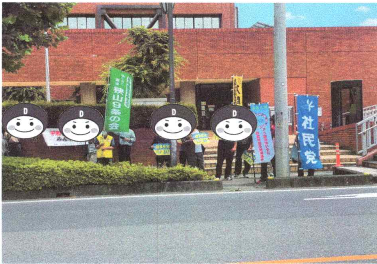
交通量のある街道沿いのスタンディングで住民へアピール

行する方に訴え、集団 的自衛権の行使、9条 改憲し他国に攻め込む 直面に危険だと思いま す。 日本国憲法9条生か して、各国の地域の国々 と外交で平和をつくる ことによって、知恵と 力を注ぐことができる 人達を選ぶことの大切 さ参加して勉強させて もらいました。 【松井房雄 記】