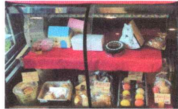
焼き菓子も充実しています

東所沢に「父がフランスでケー キの技術を学び育て上 げたクラシックケー キの味を受け継ぎ、小 さい子供からお年寄り までなるべく手ごろな 価格で提供するのがこ だわり」と語ってくだ さいました。ガトー フレーズ(上写真右)