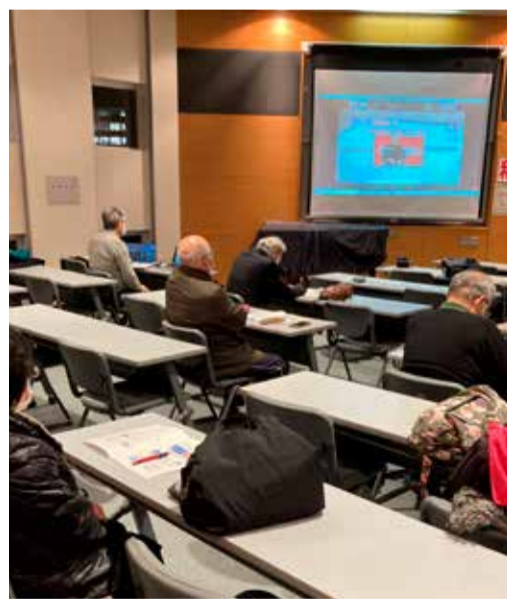
和光地域の様子＝和光市中央公民館にて

は消費税、法人税、所得税だが、不平等税制の消費税が一番高い収入となっている。消費税反対と医師不足を訴え続けなければならない。国民が納めた税金を官僚たちが勝手気ままに使っている。生活と政治が結びつくと考える人を増やしていく。