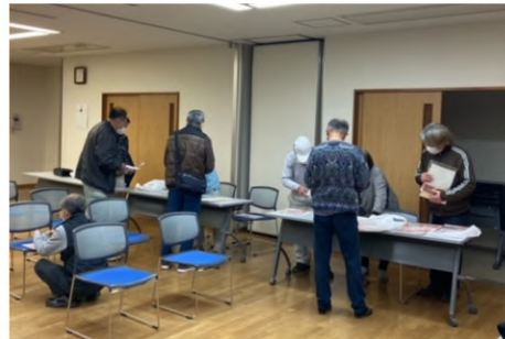
新保険証と特典袋を受け取り (東北)

3月28日・29日の両日にかけて「2022年新保険証渡し会」が取り込まれました。今年も、新型コロナウイルス感染症予防対策として、分会ごとに会場・日時を分け、短時間での開催となりました。