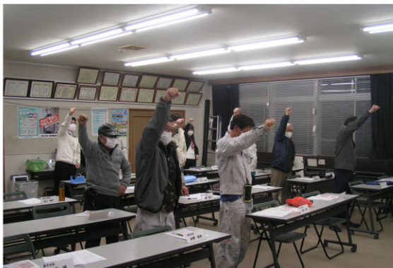
総目標達成に向けて「ガンバロウ」