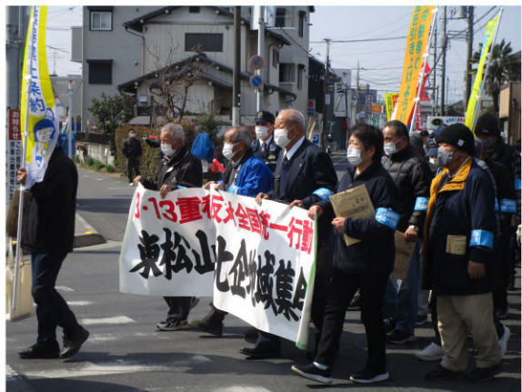
「納税者の権利を守れ」と市内をアピール

その後「政府は大企 業・アメリカ言いなりに 新自由主義路線を押し進 め、中小業者を淘汰しよ うとしている」「消費 税減税、インボイス即時 廃止、改憲阻止、年 金・社会保障の拡充、不 当な税務行政の是正、納 税者の権利擁護・発展を めざし、くらしと営業を 守る運動の前身に向けて 力を合わせよう」という アピールを採択し、集 会スローガンの確認とデ モ行進等の諸注意が事務 局からなされ、集会参加 者全体で「団結パンバロ ウ」を行いました。