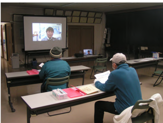
Webという「新たな」労働学校

当日の進行は、西部 4支部が分担し、各支 部の教宣部長や学習委 員長があいさつに立つ というスタイルで運営 しました。