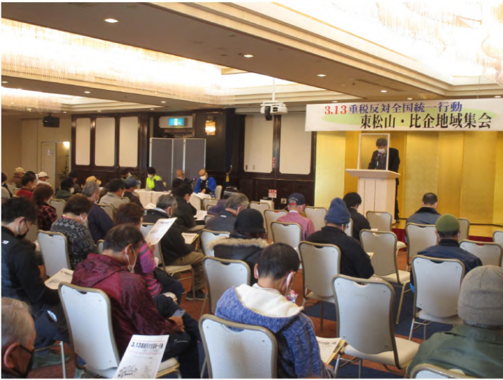
紫雲閣（屋内）で「意思統一」を行い

昨年は、コロナ禍の影響 響から屋内集会を行わ ず、市民文化センター に集合し、税務署まで移 動して集団申告のみを行 いました。 今年度は、新型コロナ 感染予防対策を徹底しな がら、紫雲閣の宴会場で の「屋内集会」を実施 その他を運営してきまし た。集会の冒頭、 支部長が実行委員会を代 表してあいさつを行い、 ロシアによるウクライナ 侵略に触れ「今回のロシ ア軍の行為は『侵略行 為』であり決して許され ない」「ウクライナ危 機に乗じた『核共有』 議論は論外。核兵器禁止 条約に参加することが日 本の採るべき道」と述べ 「消費税減税とインボイ ス制度の中止を求めて声 を上げよう」とあいさつ をしました。