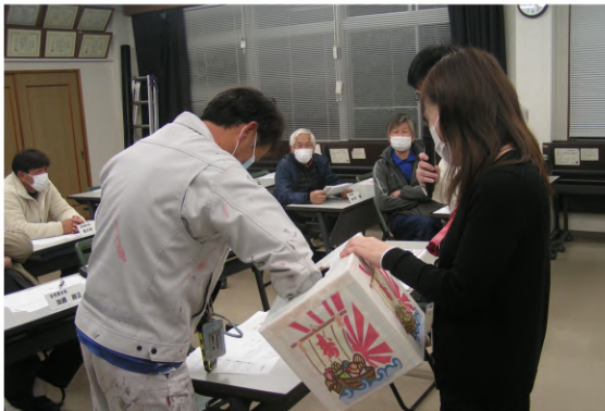
「当たれ！」願いを込めて抽選箱へ