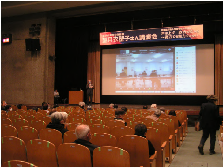
島田・比企労連議長のあいさつから始まり