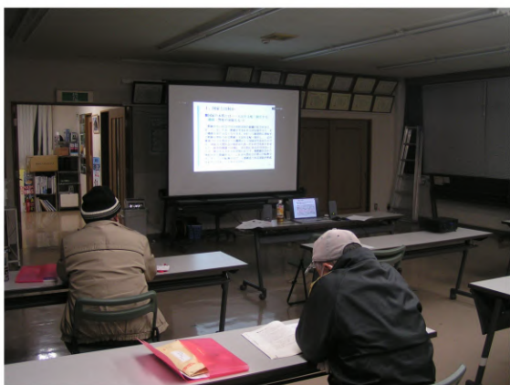
Webという「新たな」労働学校