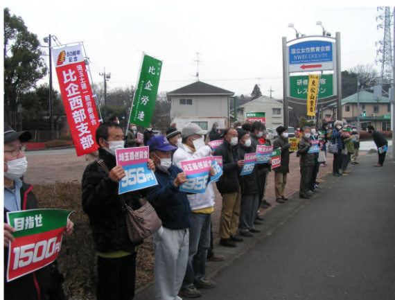
国道を行き交う車にアピール