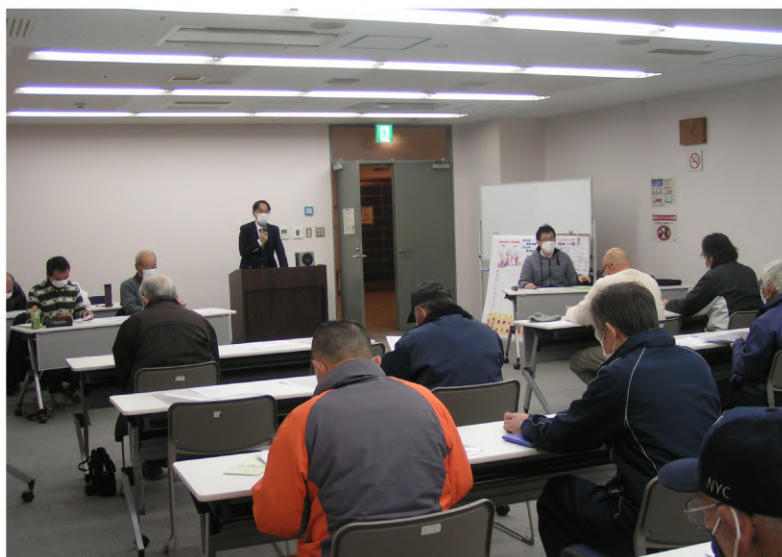
段・常任中執から国保料改定の説明を受け

「土建国保」が持つ優位性に確信をもって、仲間へ理解を深めてほしい、と話がありました。段常任中執は最後に「後期高齢者医療制度を根本的に変え、補助金、拠出金の仕組み、国の負担を増やすことが重要。夏の参院選で勝利し、建設職人の健康保険