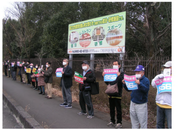
仲間と一緒に私たちの要求を掲げ