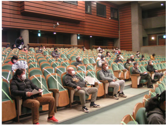
講師の話に参加者も聞き入り

講演後は、会場入り口の国道沿いで、「最賃引き上げ」や「政治を変えよう」というプラ