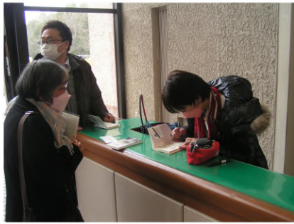
講師によるサイン会も

カードを参加者が持つて、スタンディング行動を行いました。その中で、支部長をはじめ六人の参加者からのリレートークと賃上げや憲法を守ろう、消費税廃止など、沿道に向けてアピールを行いました。