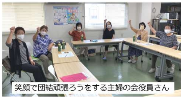
笑顔で団結頑張ろうをする主婦の会役員さん

自治体も一返答ですが、市に対しての様々な意見や要望は、訴えないと何も変わりません。気になったことなどは要望し、さらに運動に発展させ、要求を実現させましょう。