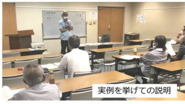
実例を挙げての説明

すい講演でした。 また、第4章の労働組合の社会的役割のところでは、ホワイトボードを使って図を描き説明する姿は、建設職人ではなく、大学の教授かなと思ってしまうほどでした。 来年には哲学や経済もできてしまうのではないかと思ってしまうました。