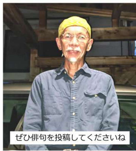
ぜひ俳句を投稿してくださいね