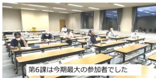
第6課は今期最大の参加者でした