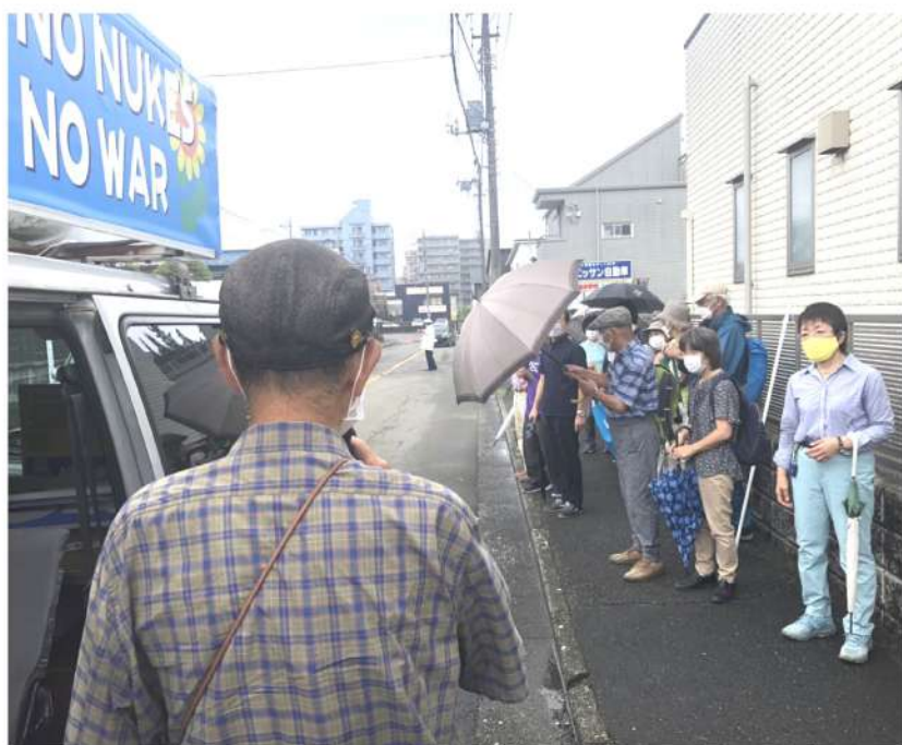
雨の降る中、数年ぶりのデモ行進。長距離を練り歩く！