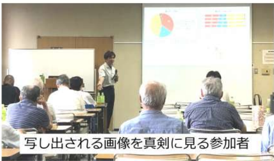
写し出される画像を真剣に見る参加者

7月3日(日)拡大執行委員会を行い全分会から30名が参加しました。午前中は通常の執行委員会、午後は7月10日に迫った参議院選