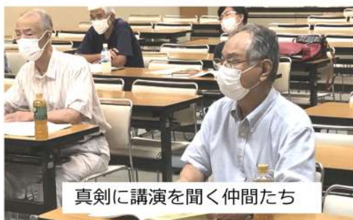
真剣に講演を聞く仲間たち

ということもあり、学校形式で受講者があてられたり、教科書を読んだり、良い緊張感がありました。 また、地労連議長と