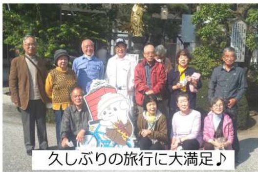
久しぶりの旅行に大満足♪

10月23日、24日に支部シニアの会「のんびりクラブ」の一泊旅行13人で行ってきました。1日目は天気恵まれ汗ばむほどでした。大谷石の切り出し後の壮大な採掘跡等を見学し日光東照宮を案内人付きで参拝し、かなりきつい行程ののんびり?クラブでした。2日目の工程をゆくりとる予定でしたが、中禅寺湖に着くころには、霧が深くなり華厳の滝を見られず、遊覧船にも乗れず午前中から、止めたバスの中が思いかげず宴会場となりました。昼食時間待ちとなったものの、初めて参加した女性の仲間からも