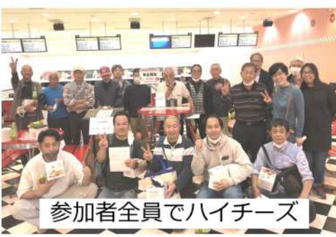
参加者全員でハイチーズ

拡大ばかりではなく身体を動かそうと企画し、賞品も個人賞として優勝、飛び賞(5位、