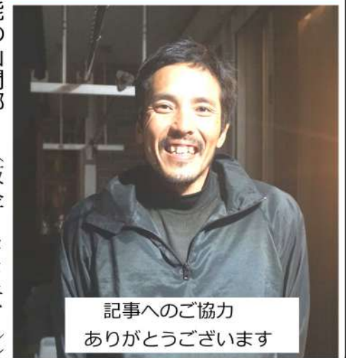
記事へのご協力ありがとうございます