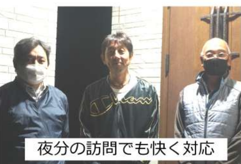
夜分の訪問でも快く対応

訪問では、仕事状況や、困っていることがないかを聞き取り、次世代部行事のムーミンバレーパークを勧め、