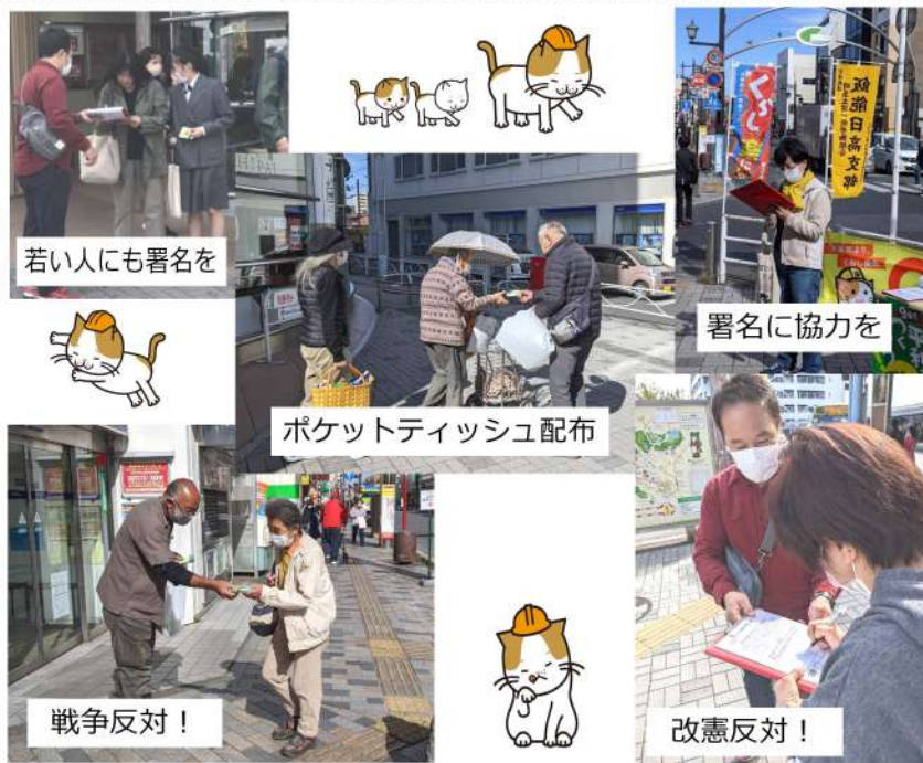
若い人にも署名を

最後に入間支部の藤掛書記長より、「埼玉土建では、インボイス反対という立場です。国の税収は過去最高となっているのに、なぜまた税金をとるのか。