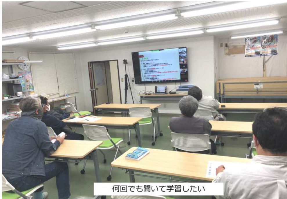
何回でも聞いて学習したい