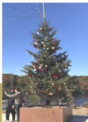
メッツァビレッジもクリスマスモード