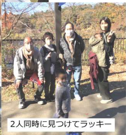
2人同時に見つけてラッキー