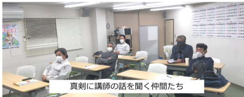
真剣に講師の話を聞く仲間たち