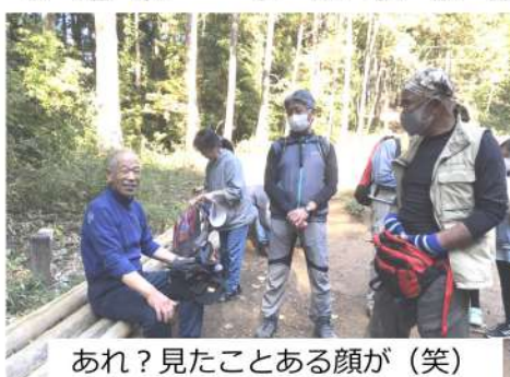
あれ?見たことある顔が(笑)

コースは埼玉土建の駐車場を出発し、コース途中のクイズを解きながら天覧山・多峯主山・吾妻渓をめぐり、最後に飯能河原のバーベキューで交流しました。