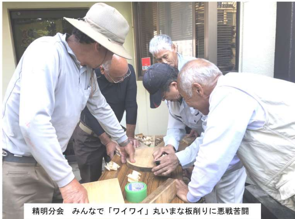
精明分会 みんなで「ワイワイ」丸いまな板削りに悪戦苦闘

発行所 357-0005 埼玉県飯能市原町142-5 埼玉土建一般労働組合 飯能日高支部 発行人 教宣部長 岩間 靖友 Tel 042-974-0330 Fax 042-971-3287 E-mail hannouhidaka@saitama-doken.or.jp