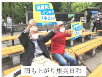
雨も上がり集会日和