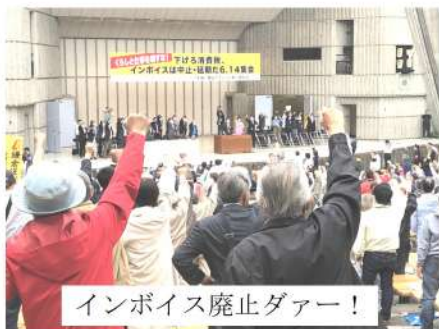
インボイス廃止大集會!

以前からの役員の成りて不足や、次世代の課題も浮き彫りになりました。17日には、部会を行い、住宅デーの総括を行い、各分会部長も仲間の参加も同じ顔ぶれで、来場者も少なかったとの感想が多く、来年度は「自分たちが楽しいと思う住宅デーにしよう」と、すでに次年度へ動き出しています。………分会の様子は2面へ