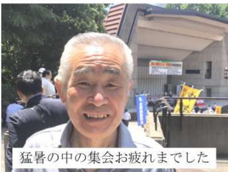
猛暑の中の集会お疲れまでした