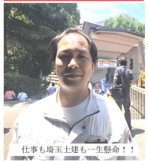
仕事も埼玉土建も一生懸命！

今月から、「PICKUP」という連載をスタートします。いろいろな仲間を載せていきますのでご期待下さい。これを読んでいる仲間の皆さんにも声が掛かるかも！そんな時は嫌がらず、引き受けて下さいね！よろしくお願ひします。それでは行ってみよう！