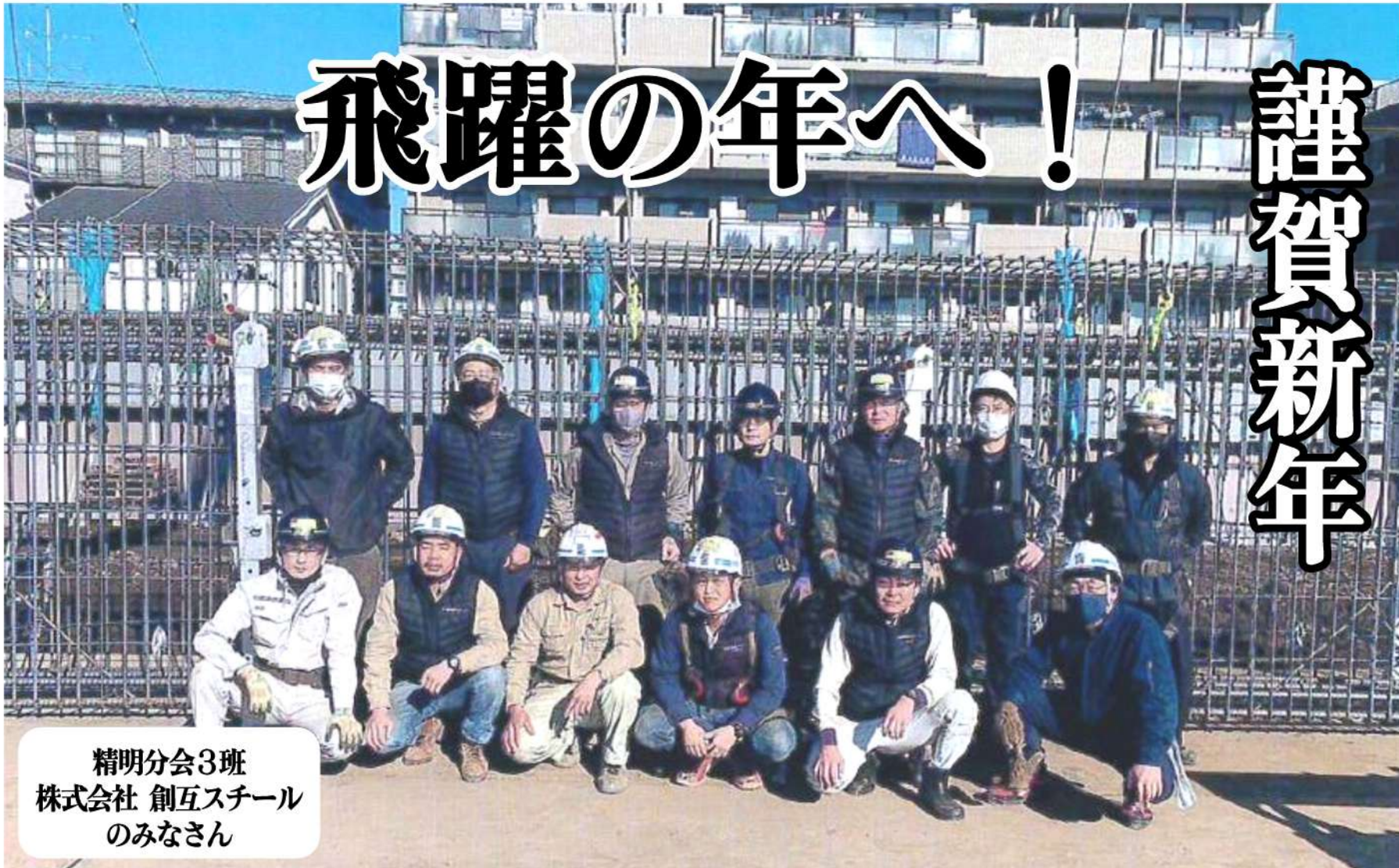
精明分会3班 株式会社 創互スチール のみなさん