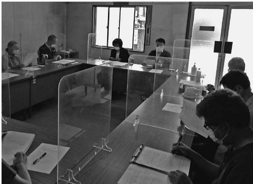
6団体9人が参加して=朝霞市役所にて

21年原水爆禁止国民平和大行進は、6月27日に新座市・志木市、6月28日に朝霞市、6月29日に和光市で行われました。 志木地域は学習会、朝霞地域は対市懇談、和光地域は対市懇談、駅頭宣伝と三密を避けてデモ行進は行いませんでした。