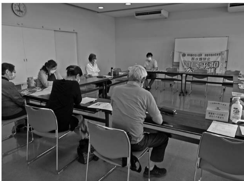
志木市民会館パルシティで開催された志木地域での様子