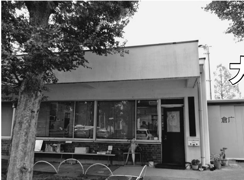
和光市の理研敷地内にある理研労組建物