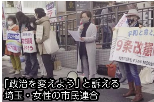
「政治を変えよう」と訴える 埼玉・女性の市民連合