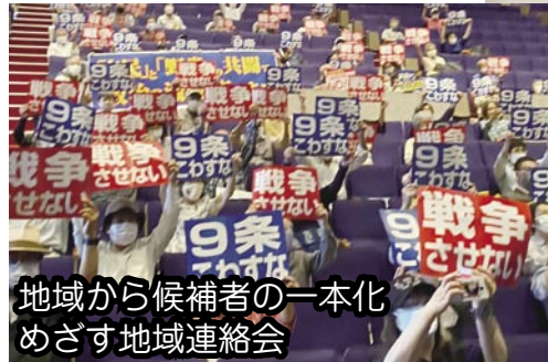
地域から候補者の一本化 めざす地域連絡会

9月8日、市民連合と野党4党（立憲民主党、日本共産党、社民党、れいわ新選組）は、以下の共通政策に合意しました。