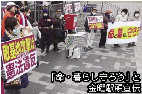
「命・暮らしを守ろう」と 金曜駅前宣伝