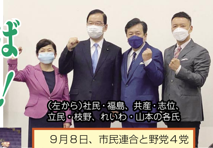
(左から)社民・福島、共産・志位、立民・枝野、れいわ・山本の各氏