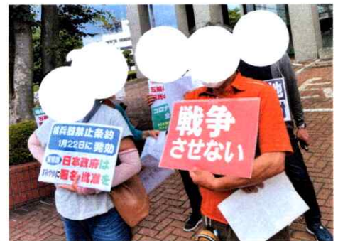
戦争させないと平和をアピール

6月27日、入間市役所前で2021国民平和大行進が行われ、支部から7人、全体で45人が参加。コロナ禍のため行進せずに集会のみとなりました。参加者からは核兵器禁止条約が発効され批准国は54カ国に。一