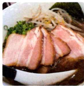
人気手作りワンタン