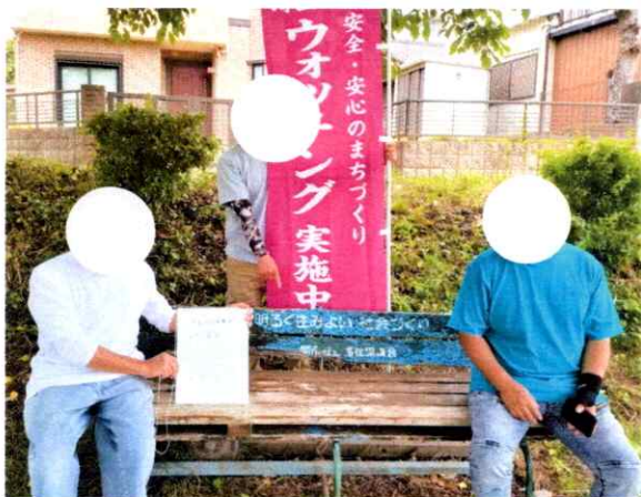
老朽化したベンチを発見(桜野)