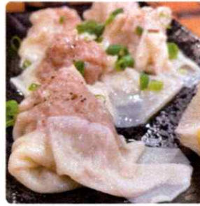
焼豚も美味ですよ