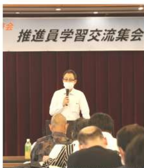
推進員学習交流集会

午前は共済会20周年記念講演として埼玉連新島議長が総選挙をふまえた情勢と共済活動の役割を講演しました。午後は基調報告・学習、共済会の歩みなどをスライドで視聴し、ビデオメッセージでありさつをいただき、その他、報告や交流を行いました。最後