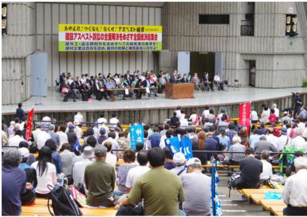
6. 16建設アスベスト訴訟の全国決起集会の様子