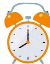
●短時間の班会議運営