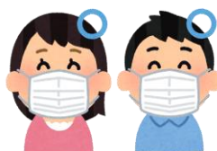
●マスクの着用の徹底