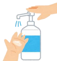
●消毒液を常備します