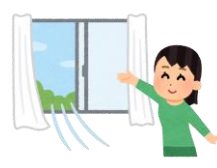
●会場の喚起の実施