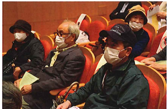
新座からも仲間が参加