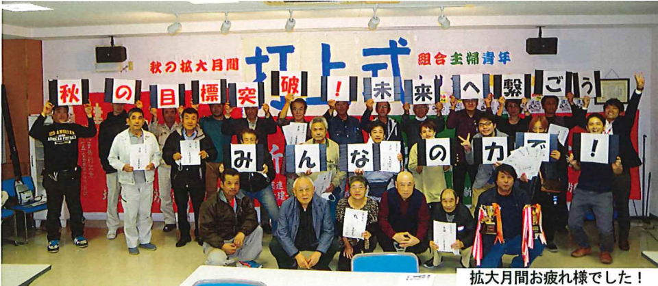
拡大月間お疲れ様でした！