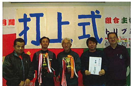
野火止北分会は目標の242.9%達成の快挙