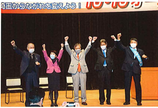
埼玉から流れを変えよう！と団結