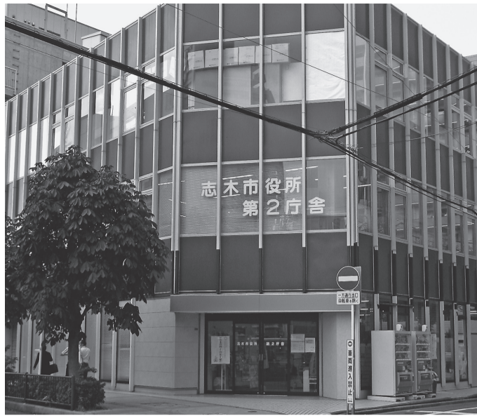
取材に行った志木市役所第2庁舎

給)、「法人市民税の均等割額の減免」などがあります。 市民の生活を支える支援として「プレミアム付き商品券」発行の予定、「水道料金の基本料金を50%減額」、「児童扶養手当の加算(3万円を5月と7月に加算済み)」、「新生児子育て応援金」(特別定額給付金の対象とならなかった、令和2年4月28日以降に生まれたお子さんを育てている保護者)に対し、お子さん1人につき10万円を支給)などがあります。