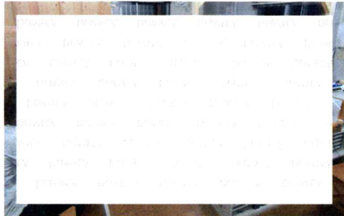
ソーシャルディスタンスに注意して

支部青年部はコロナウイルス感染症の影響で、4月から青年部会の開催を見送っていましたが、7月16日に4か月ぶりに短時間で開催しました。久しぶりの開催