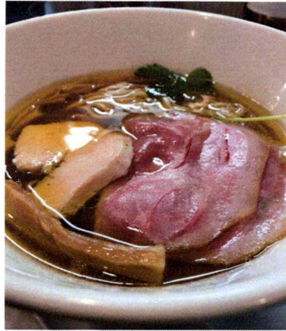
大きなチャシュー・メンマも魅力