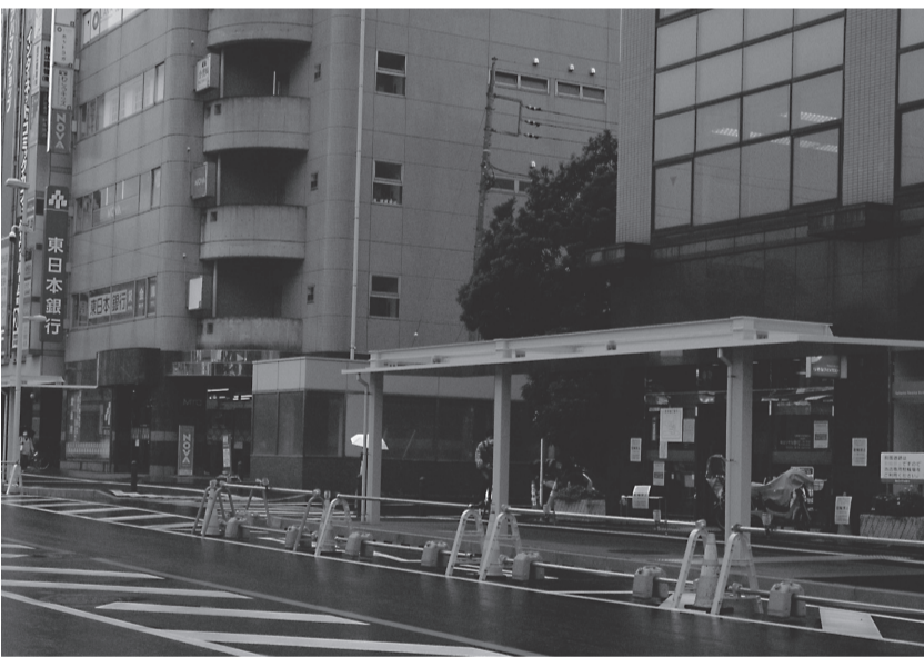
シャトルバスが発着する和光市駅南口

解答・具体的な検討はされていません。しかし、射撃の会場が陸上自衛隊朝霞訓練場となつてお