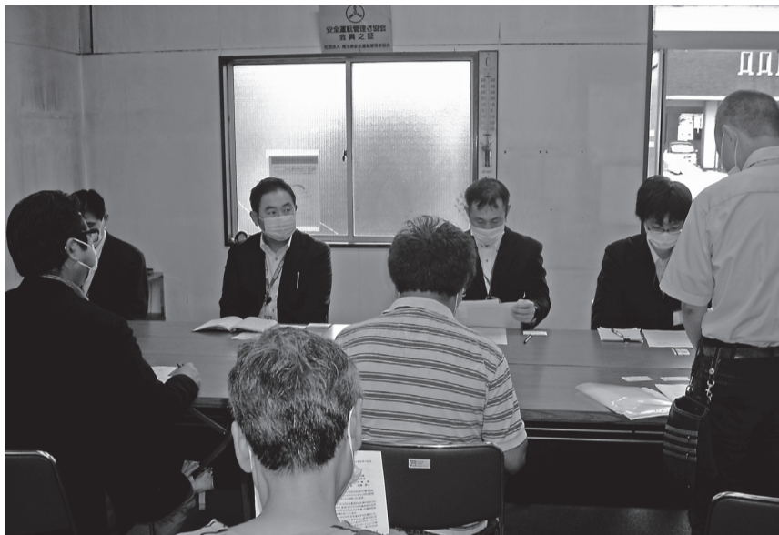
朝霞市人権庶務課から4人の職員が対応し

20年原水爆禁止国民平和大行進は、例年通り7月の第一週目の日曜日、新座市・志木市から始まりました。志木地域は学習会、朝霞地域は市職員との懇談、和光地域は駅頭宣伝と三密をさけるため集会・デモ行進は行わずに開催しました。