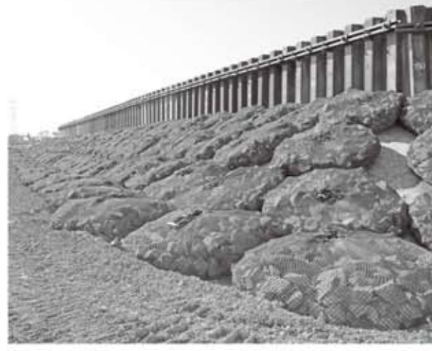
都幾川の堤防修復場所

すぐ脇にあった光明寺というお寺では、高台にはなっているが、「床上1m30cm位まで水が来て位牌がぶかぶか浮いてしまった。」と住職さんが話してくれました。又決壊部分の土手で散歩して