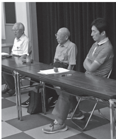
戦争体験者2人の講演

が訪れている中、沖縄の激戦で多くの尊い命が犠牲になった歴史を伝え、現在も基地問題を抱えている様子をパネルでわかりやすく、詳しく展示してあるのを見学しました。その中に私たちの仲間が、熱心に書籍や展示品などを見入る姿もありました。 当日は13時30分から戦争体験者2人の講演があり、用意された椅子は全て埋め尽くされている状況の中、話を聞くことができませんでした。その一人は、「小学校の頃から戦争教育で礼儀は厳しかった」「朝鮮鉄道に入り、現地におもむき働いたが、振り返れば現地の人もう少し相手を思いやる心が欲しかった」と語