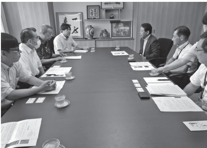
志木市の香川市長との懇談

ントについて討議中。5年に1度の花火大会も来年度予定している」とのこと。CCUSについては、昨年同様「聞いたことが無い」との返答でした。また耐震診断の話では、志木ニュータウン以外の個別宅は、ほとんど完了したとのこと。また志木ニュータウンの居住者は、40%が高齢と語っていました。災害時の応急対策については、「検討いただけるとありがたい。ただ朝霞・志木・和光の3地域管轄の支部なので3市と一緒に取り組んで頂いた方がいいと思う。」と前向きな発言を頂きました。また他市に比べて公共事業の現場訪問場所がないとの話に「現場訪問」「アンケート」と言われると構えて