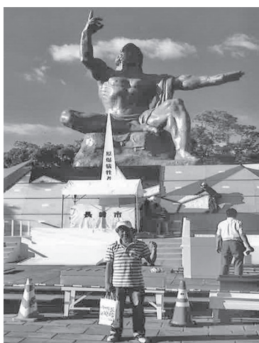
銅像の前で握り拳!

「被爆者が実際に体験 した事を直接聞きたい。 被爆者の想いや願いを受 け取りたい」とこの時期 になると広島長崎に行 つてみたいと思いつつ、 8月7日(9日)に念願の 長崎原水爆禁止世界大会 に参加する事ができまし た。 1日目の全体会で1番 の盛り上がりを見せたの は、国民平和大行進の参 加者が登場した時でし た。外国の人も参加し感 動した様子でした。私は 正直、国民平和大行進が ここにつながっている事 を知らなかったため、今 まで一度も参加した事が 無く恥ずかしい想いをし ました。これからは先頭 に立つて参加しようと思 いました。2日目は、 「佐世保湾基地調査」分 科会に参加し、美しい 島々と美しい形の港でし たが、軍艦が我が物顔で