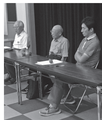
戦争体験者2人の講演

『地球上から戦争なくなれ』をスローガンに、第14回朝霞・平和のため戦争展が、8月24日(土)〜26日(月)に朝霞市立図書館で開催されました。 私は、2日目の25日(日)に行き、大勢の人が訪れている中、沖縄の激戦で多くの尊い命が犠牲になった歴史を伝え、現在も基地問題を抱えている様子をパネルでわかりやすく、詳しく展示してあるのを見学しました。その中に私たちの仲間が、熱心に書籍や展示