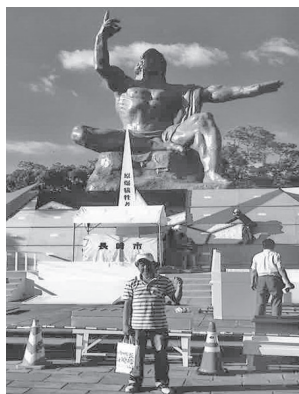
銅像の前で握り拳!