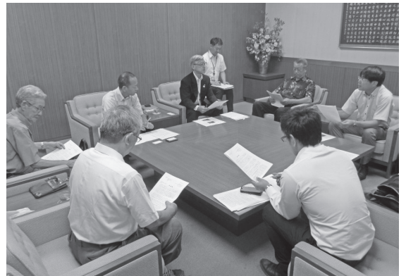
朝霞市の関野副市長との懇談