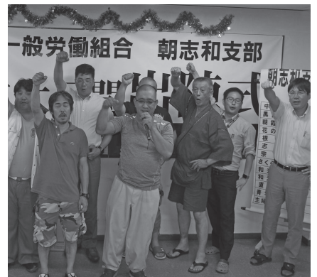
西次世代部長を中心に団結ガンパロー!

長からは、「組合費滞納 から脱退へ繋がる方向性 の仲間が多く、現在30 00人を切っている。早 期に3000人支部に戻 すため、脱退防止対策と して、分会からも未納者 の仲間への声掛けをお願 いします。」と訴えがあ り、名雪組織部長から 「支部目標1300人。青