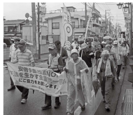
雨の中のデモ行進(朝霞地域)