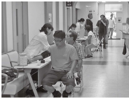
根岸分会の健康診断の様子

会場が新しくなり、戸惑う受診者が居るのではないか、心配しましたが全く混乱は無く順調に行われました。特に例年なら7時の時点で十数人は待っている人が居ましたが、早く行っても会場の扉が開いていない為、意味が無い事が浸透し、今年、車の中で2人が待つているくらいでした。私たちは、受付の準備があるので他の扉から先に入れてもらいました。扉が開いたのは、受付開始8時の15分前でした。