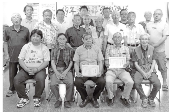
支部労働学校卒業式に参加した受講者