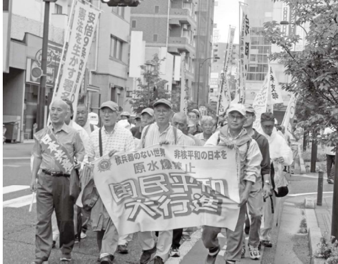
雨にも負けないデモ行進(志木地域)