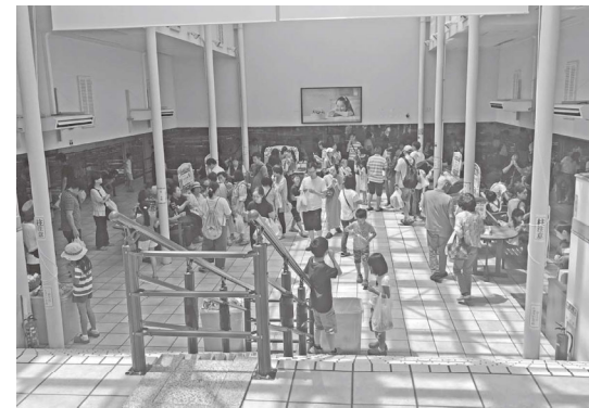
シャトラーゼ工場内

7月28日(日)に46人の参加で山梨県方面にバスハイクを行いました。当日は、台風の予報が出ていましたが、雨は集合時だけでその後はずっと晴れていました。最初の目的地「シャトラーゼ工場」は、見学時刻に少しも遅れてしまうと入場することができないので、余裕をみて4時間前に出発しました。高速道路は、渋滞も無く目的地に早く着きすぎず、サビエリアで長めの休憩を何回もとりましたが向かいました。シャトラーゼ工場に到着し、見学は自由。ほとんどの参加者が、パネルやスクリーンを見ないで、工場の奥にあるアイス試食コーナーへと足早に向きました。試食は、6種類のアイス好きだけ食べることができ、一番多く食べたのは5個。食べ過ぎてお腹を壊した人もいました。その後、「FUJIフルーツパーク」へ行き、昼食となりました。悪天候が続いた為、メロン狩りができず、大きなメロンをお土産に1人ひとり配布されました。 最後に「桔梗信玄餅工場」へ行き工場見学や買い物などを自由に行い、帰路につきました。最後の解散場所の和光に到着したのは、午後6時となりました。 【書記局 門田大樹】