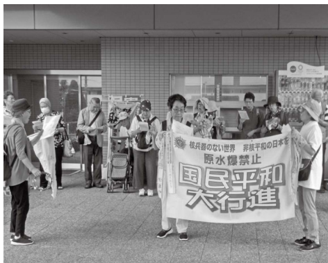
集会で平和の歌を歌いました(和光地域)