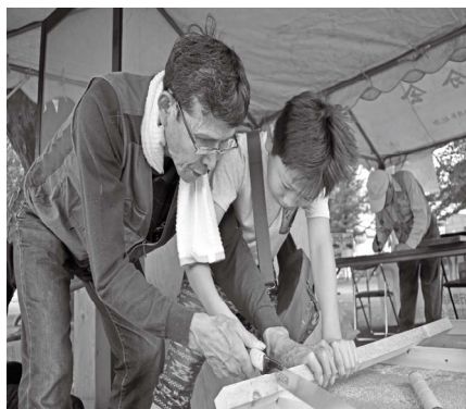
子ども鋸の使い方を伝授!

参加した仲間たちからは、口々に開催中に雨が降らなくて良かった、胸をなで下ろしていたのが今回の住宅デーの特徴でした。