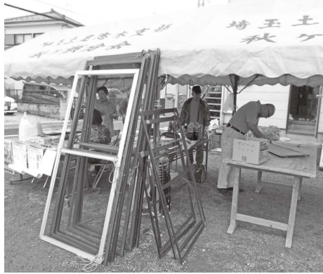
網戸の張り替えの依頼がたくさん