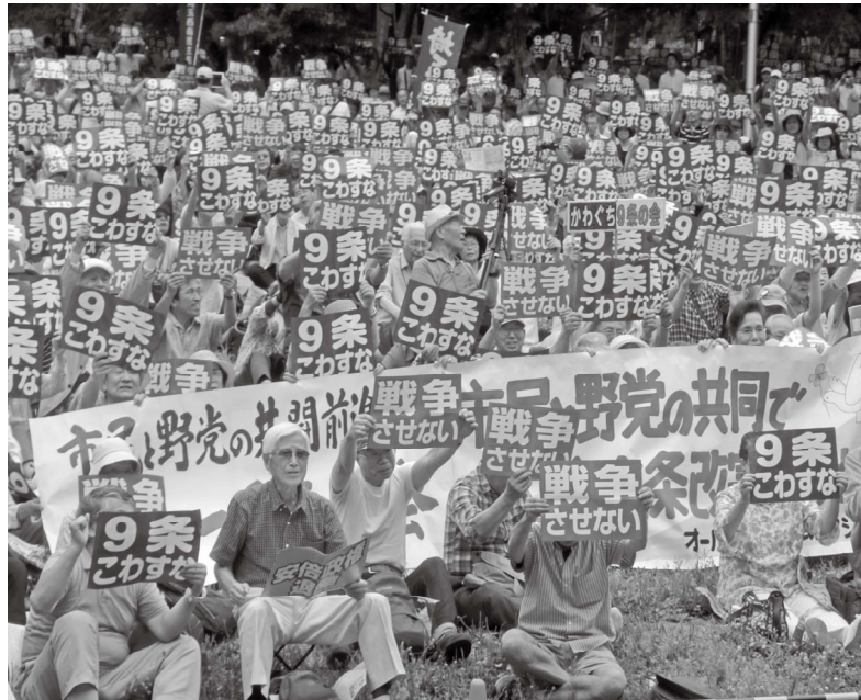
プラカードを掲げ会場を埋めつくす