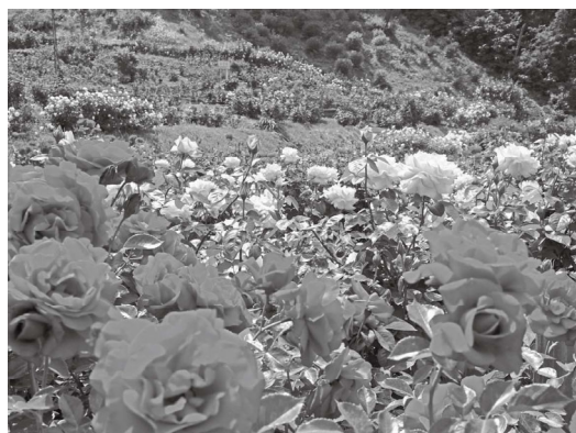
2万株あまりのバラ