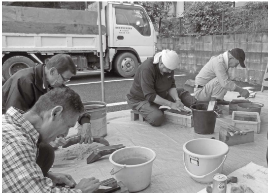
複数体制で包丁砥ぎ

6月9日(日) 根岸分会の住宅デーは、根岸市民センターの駐車場で、くもり空の中24人が集まり午前9時からテント3個を組み立てて、準備が終わりまりました。9時50分頃にまな板と包丁を持って来る人があり、10時から5人の大工さんが砥ぎ初め、午前中は汗をかいて多いそがしでした。めだかすくいも、用意