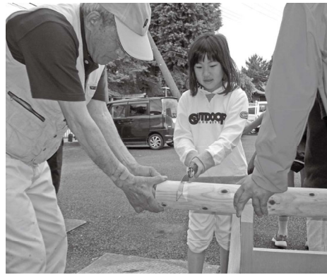
丸太切りに挑戦・・・